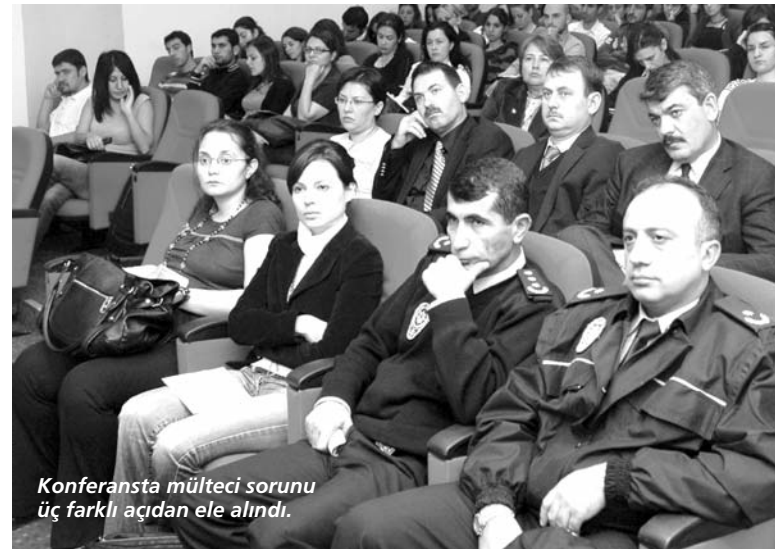
Konferansta mülteci sorunu üç farklı açıdan ele alındı.