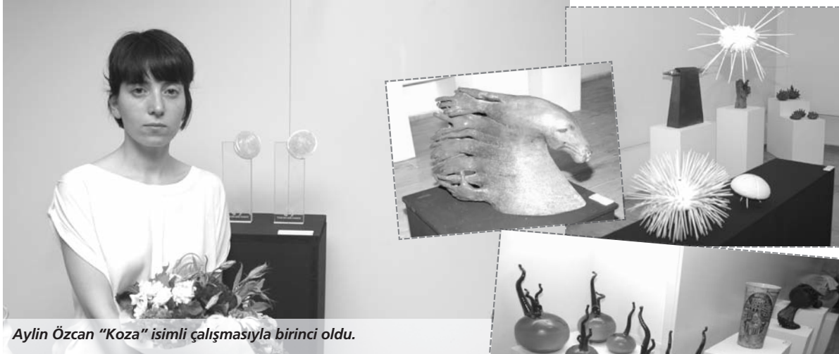
Aylin Özcan "Koza" isimli çalışmasıyla birinci oldu.