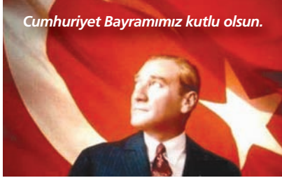
Cumhuriyet Bayramımız kutlu olsun.

■ Hukuk Fakültesi, "İnsan Hakları Bağlamında Mülteci Sorunu" konulu bir konferans düzenledi. Konferansta, Türkiye'de yaşanan mülteci sorunları değişik açılardan ele alındı. ▶ 3. SAYFADA