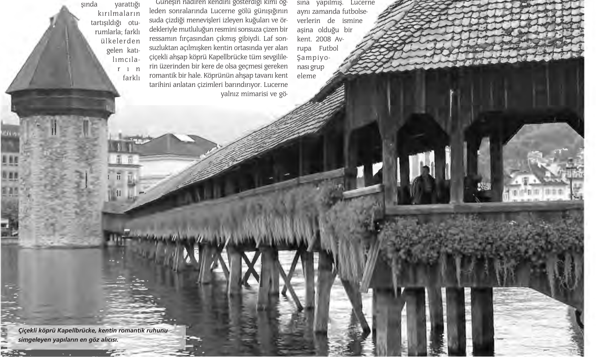
Çiçekli köprü Kapellbrücke, kentin romantik ruhunu simgeleyen yapıların en göz alıcısı.

Son olarak Lucerne'den geriye kalanlar ne dersiniz: Eluard'ın dizelerindeki gibi "soğukta çiçek, güneşte nehir" olan, içine gömdüğü tutkusunu çiçeklerle süsleyen, gelmeyecek sevgiliyi beyaz kuğular gibi dingince bekleyen, Thorwaldsen'in Aslan'ı gibi yaralı bakışlı, güzel elleri olan bir kent Lucerne.