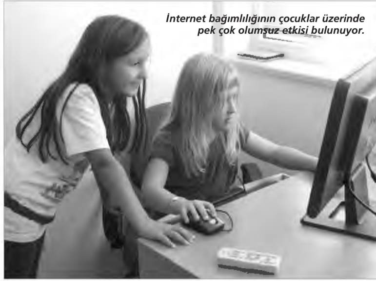
İnternet bağımlılığının çocuklar üzerinde pek çok olumsuz etkisi bulunuyor.