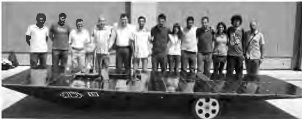
Anadolu Üniversitesi Güneş Arabası Takımı, Formula G yarışında büyük bir başarı göstererek ikinci sırayı aldı. Takımın diğer arabası ise yarışta dördüncü sırada bitirdi.

Anadolu Üniversitesi Bilimsel Araştırma Projeleri (BAP) kapsamında desteklenen ve ileri teknoloji kullanılarak donatılmış "Thunderbird" adlı araç, ana iskeleti oluşturan hafif karbon fiber kompozit malzemesi ile sürücüsüz 168 kg ile yarışlardaki en hafif araç ünvanını da aldı. Aracın yapımında Mühendislik