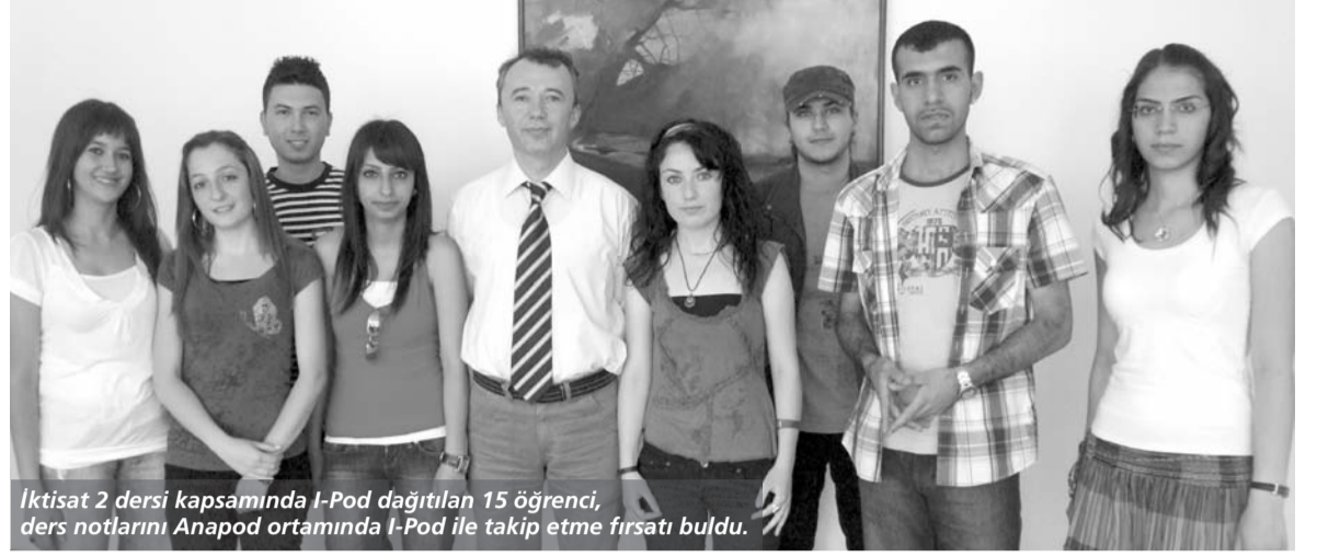
İktisat 2 dersi kapsamında I-Pod dağıtılan 15 öğrenci, ders notlarını Anapod ortamında I-Pod ile takip etme fırsatı buldu.