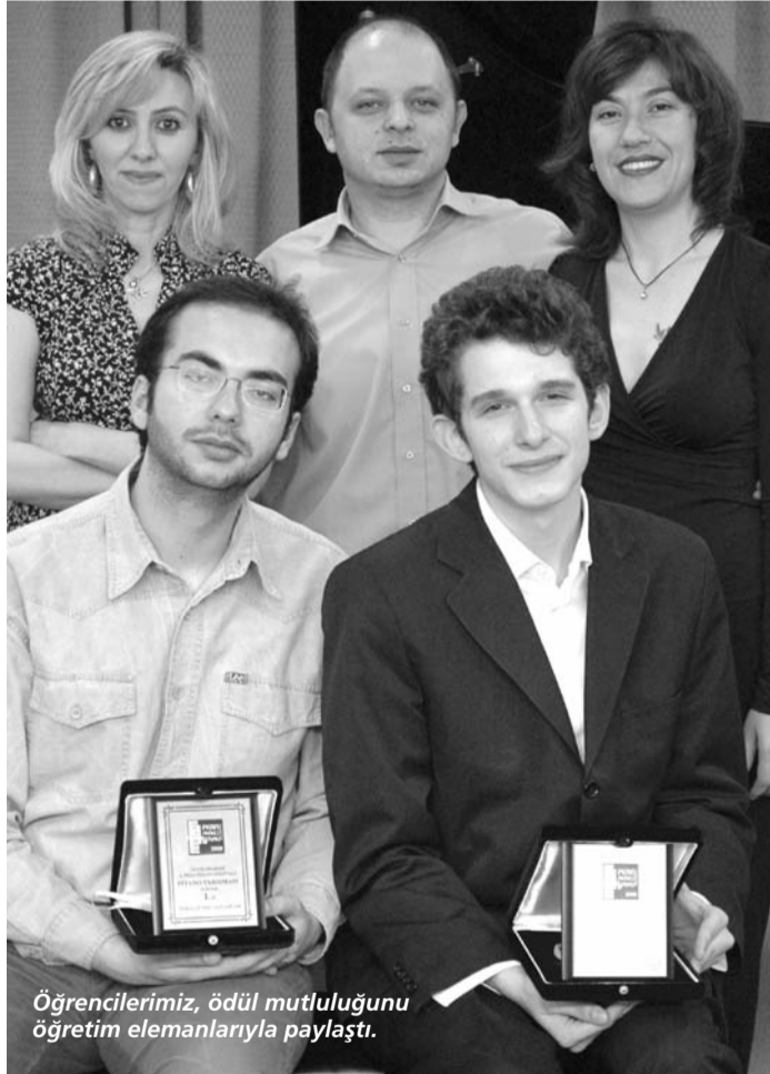
Öğrencilerimiz, ödül mutluluğunu öğretim elemanlarıyla paylaştı.