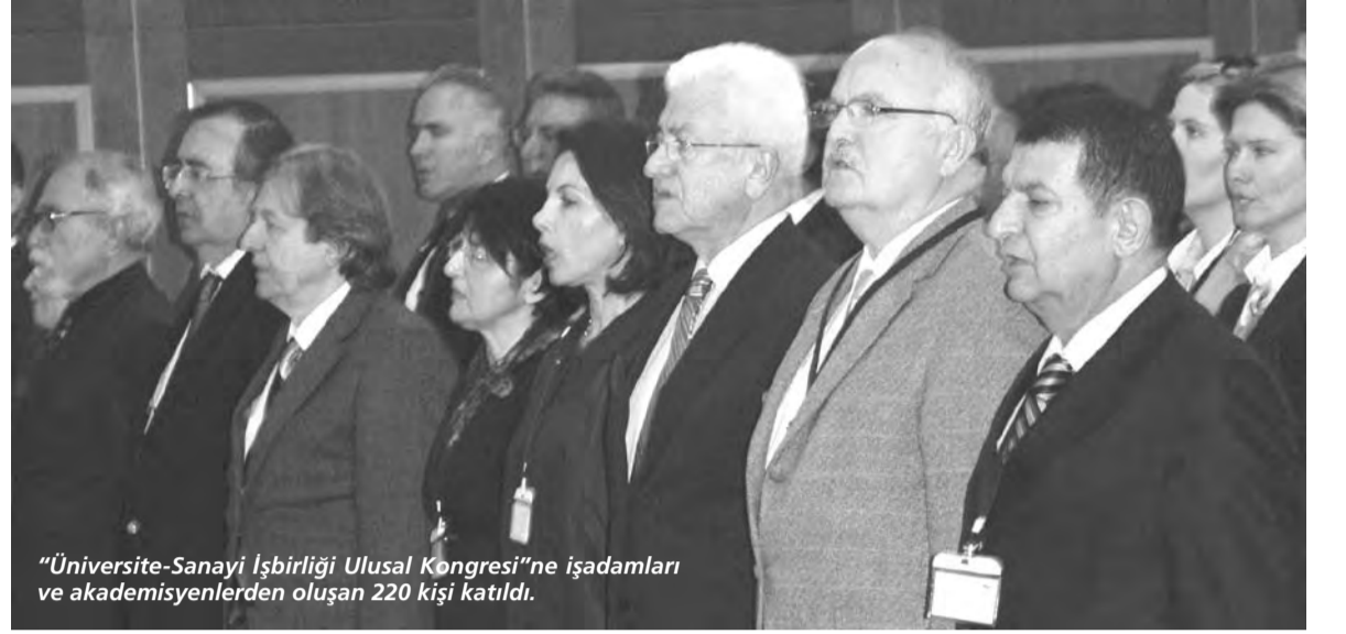
"Üniversite-Sanayi İşbirliği Ulusal Kongresi"ne işadamları ve akademisyenlerden oluşan 220 kişi katıldı.