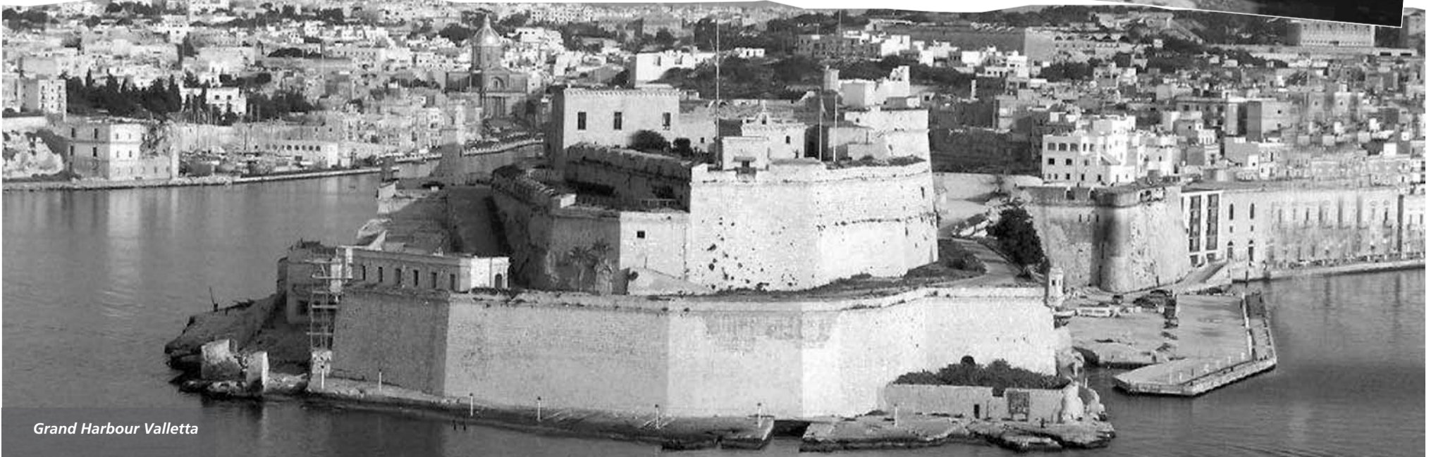
Grand Harbour Valetta