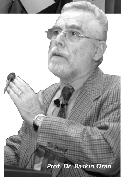
Prof. Dr. Baskın Oran