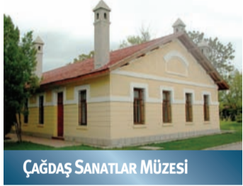
ÇAĞDAŞ SANATLAR MÜZESİ

Anadolu Üniversitesi Yunussemre Kampüsü'nün merkezinde yer alan Çağdaş Sanatlar Müzesi, Birinci Ulusal Mimarlık Dönemi örneklerindedir. Müze koleksiyonunda 158 Türk, 50 yabancı toplam 208 sanatçının yapıtı bulunmaktadır. Müze; tatil günleri dışında 9.00 - 12.00, 13.30 - 18.00 arasında ziyaretçilere açıktır.