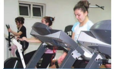
İKİ EYLÜL SPOR TESİSİ

■ Anadolu Üniversitesi, öğrencilerine derslerinden ve çalışma saatlerinden boş kalan zamanlarını hem eğlenceli hem yararlı, hem de sağlıklı geçirmeleri için birçok spor tesisi kurmuş ve bütün öğrencilerin yararlanabileceği şekilde faaliyete sunmuştur.