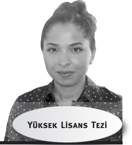
YÜKSEK LISANS TEZİ