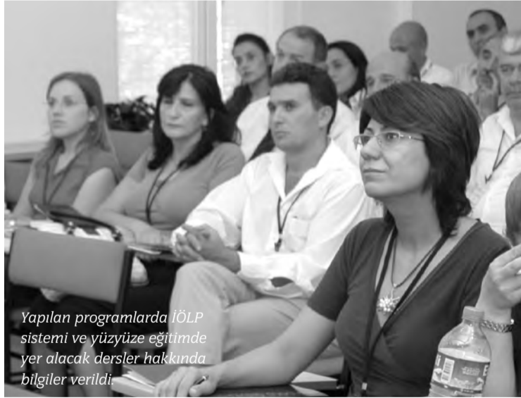
Yapılan programlarda İÖLP sistemi ve yüz yüze eğitimde yer alacak dersler hakkında bilgiler verildi.