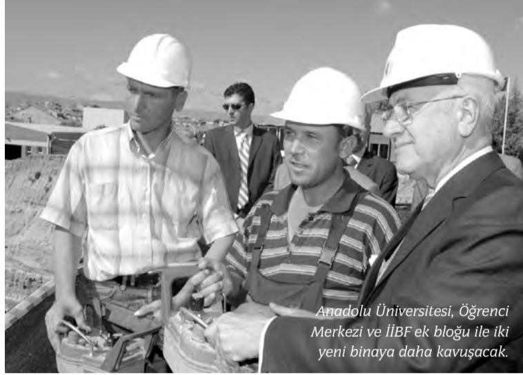
Anadolu Üniversitesi, Öğrenci Merkezi ve İİBF ek bloğu ile iki yeni binaya daha kavuşacak.