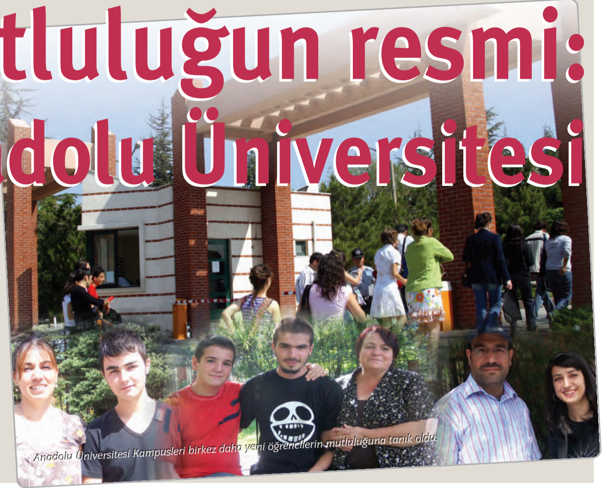
Anadolu Üniversitesi Kampusleri birkez daha yeni öğrencilerin mutluluğuna tanık oldu.