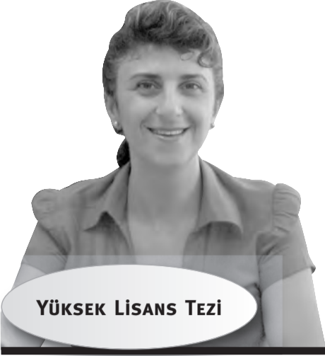
YÜKSEK LISANS TEZİ