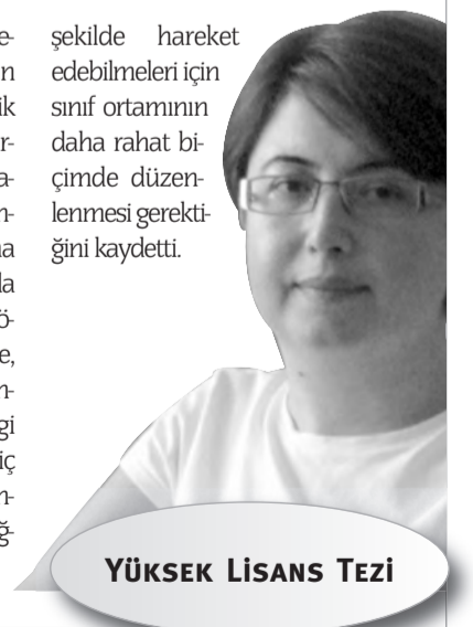
YÜKSEK LİSANS TEZİ

şekilde hareket edebilmeleri için sınıf ortamının daha rahat biçimde düzenlenmesi gerektiğini kaydetti.