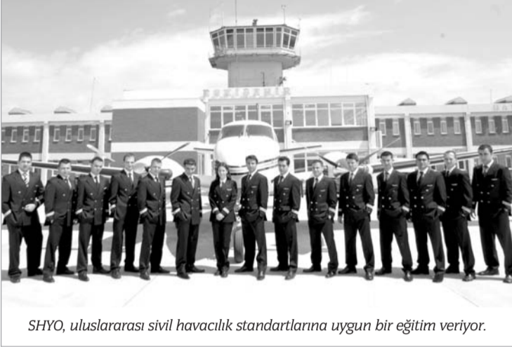
SHYO, uluslararası sivil havacılık standartlarına uygun bir eğitim veriyor.

Sivil Havacılık Yüksekokulu, ilk günden beri dünyanın önde gelen havacılık kurumları ve ülkemin havacılıkla ilgili tüm kurumlarınınca da destekleniyor. Ulaştırma Bakanlığı Sivil Havacılık Genel Müdürlüğü, Devlet Hava Meydan-