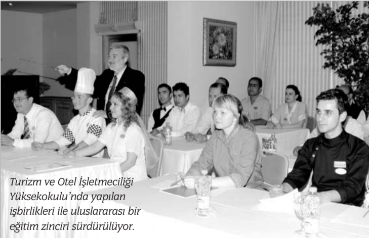
Turizm ve Otel İşletmeciliği Yüksekokulu'nda yapılan işbirlikleri ile uluslararası bir eğitim zinciri sürdürülüyor.

■ Turizm ve Otel İşletmeciliği Yüksekokulu, 1993 yılından bu yana turizm sektörünün gereksinim duyduğu insan gücünü yetiştirmeyi amaçlıyor. Yüksekokulda sektöre uygun ders içerikleri ve uygulama çalışmalarıyla yürütülen bir eğitim anlayışı mevcut. Yabancı dil eğitiminde İngilizce'nin yanı sıra Almanca, Fransızca, Japonca, Rusça ve İspanyolca dillerini öğrenme olanağı da öğrenciler için önemli bir avantaj. Yüksekokulun tüm me-