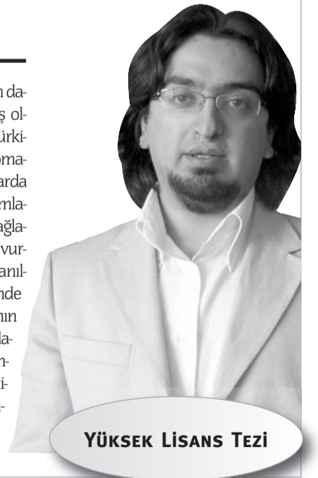
YÜKSEK LİSANS TEZİ

Kutlu, bu dönüşümün reklamların daha yaratıcı ve zekice planlanmış olmasını gerektirdiğini kaydetti. “Türkiye reklamcılık açısından ünlü komasında” diyen Ömer Kutlu, reklamlarda yaratıcılık tıkandığı zaman reklamların daha kolay hatırlanmasını sağlamak için ünlülerin kullanıldığını vurguladı. Kutlu, ünlü isimlerin kullanılmasının reklamı hatırlama yönünde olumlu etki oluştururken markanın hatırlanmasında aynı başarıya ulaşamadığını ifade etti. Türk reklamcılığının zamanla gelişme gösterdiğini belirten Kutlu, yaratıcılık açısından batı dünyasının hâlâ gerisinde olduğumuzu söyledi.