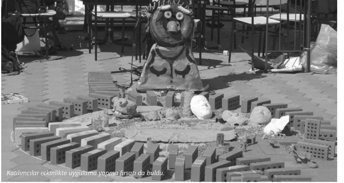
Katılımcılar etkinlikte uygulama yapma fırsatı da buldu.

Sinema Anadolu'da 26 Haziran günü yapılan açılış töreninde konuşan ESTMOB 2007 Koordinasyon Sorumlusu ve Osmangazi Üniversitesi Mühendislik Mimarlık Fakültesi Mi-