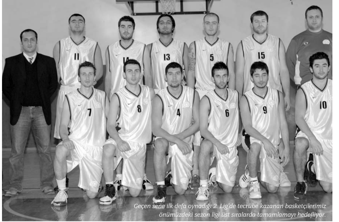
Geçen sene ilk defa oynadığı 2. Lig'de tecrübe kazanan basketçilerimiz önümüzdeki sezon ligi üst sıralarda tamamlamayı hedefliyor.

Bu yıl 90 jenerasyonlu beş çocuğumuz üniversite sınavına girdi. Beş çocuğumuzun da üniversite sınavında alacakları puanlar çok yüksek. Hepside üniversitemizdeki bölümlere girebilecekler. Birinci hedefimizi tutturmuş olduk. Bu çocuklar bu sene altyapıdan takıma girecek çocuklar. Geçen sene iki tanesi A Takıma çıktı ve bu sene de iki takıma ile dört oyuncu olarak A Takımımızda oynayacaklar. Bizim gibi altyapıdan oyuncu çıkartan üç takım var: Pertevniyal Lisesi, Efes Pilsen ve Bursa Yeşilspor. Başka aklıma gelen, altyapıdan oyuncu getirtip oynatan takım yok.