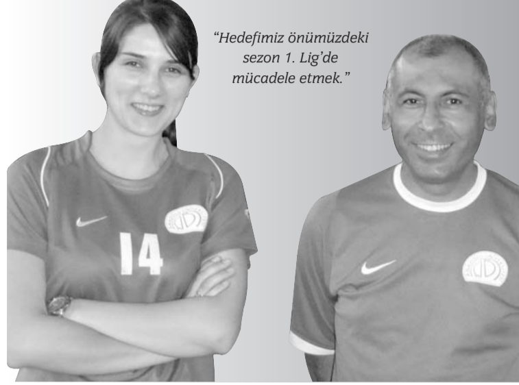
"Hedefimiz önümüzdeki sezon 1. Lig'de mücadele etmek."

Bizim üniversitemizin altyapısı Türkiye liglerinde oynayan birçok kulübün üstünde, Vakıfbank Güneş Sigorta ve Eczacıbaşı ile yarışacak kapasitede bir alt yapı. Önümüzdeki yıllarda daha da iyi olacak. Şu anda A takımında oynayan 12 kişi altyapıdan yetişmiş oyuncular. Bunun dışında iki tane de yabancı oyuncumuz var. Bu yabancı oyuncular da alt yapıdan gelen oyuncuların ge-