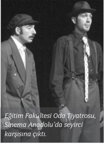
Eğitim Fakültesi Oda Tiyatrosu, Sinema Anadolu'da seyirci karşısına çıktı.