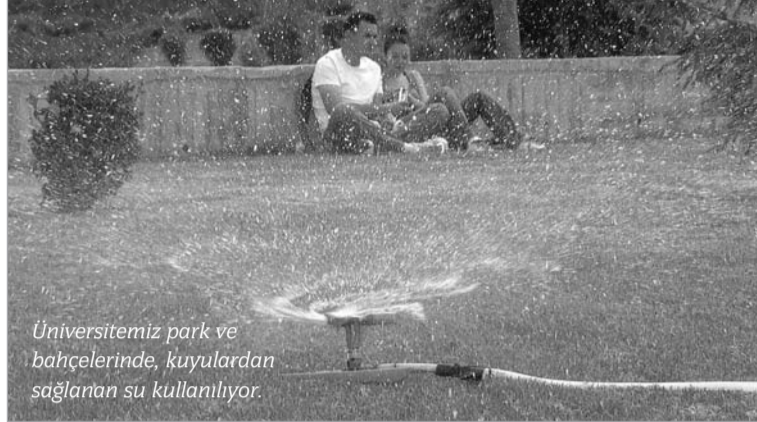
Üniversitemiz park ve bahçelerinde, kuyulardan sağlanan su kullanılıyor.

Anadolu Üniversitesinin park ve bahçelerinde kullanılan suyun, içmeye ve günlük kullanıma uygun olmayan kuyulardan sağlandığına işaret eden Varcan, Anadolu Üni-