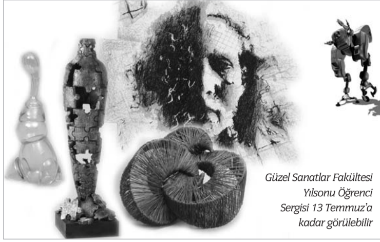
Güzel Sanatlar Fakültesi Yılsonu Öğrenci Sergisi 13 Temmuz'a kadar görülebilir