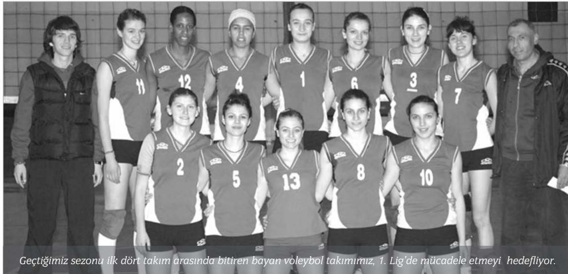
Geçtiğimiz sezonu ilk dört takım arasında bitiren bayan voleybol takımımız, 1. Lig'de mücadele etmeyi hedefliyor.

Neden olmasın. Bu sene takımındaki herkes sorumluluklarını daha iyi kavrayıp daha da bilinçlendi. Oturmuş ve tecrübeli bir takımımız artık. Önümüzdeki sene de geçtiğimiz senelerden ders alıp daha başarılı olup 1.Lige çıkabileceğimize yürekten inanıyorum. Bunu başarabilecek oyuncu kalitesine sahip bir takımız.