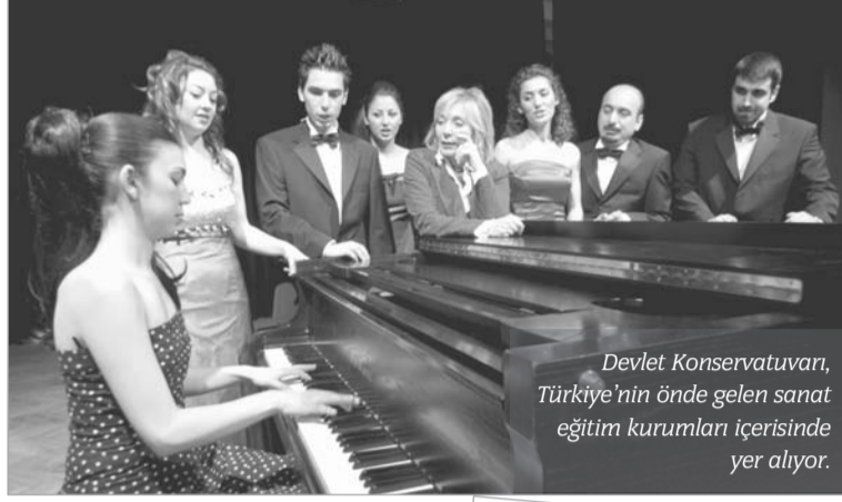
Devlet Konservatuarı, Türkiye'nin önde gelen sanat eğitim kurumları içerisinde yer alıyor.

vam ederek birçok yeni sanatçıyı aramıza katmaya devam ediyor.