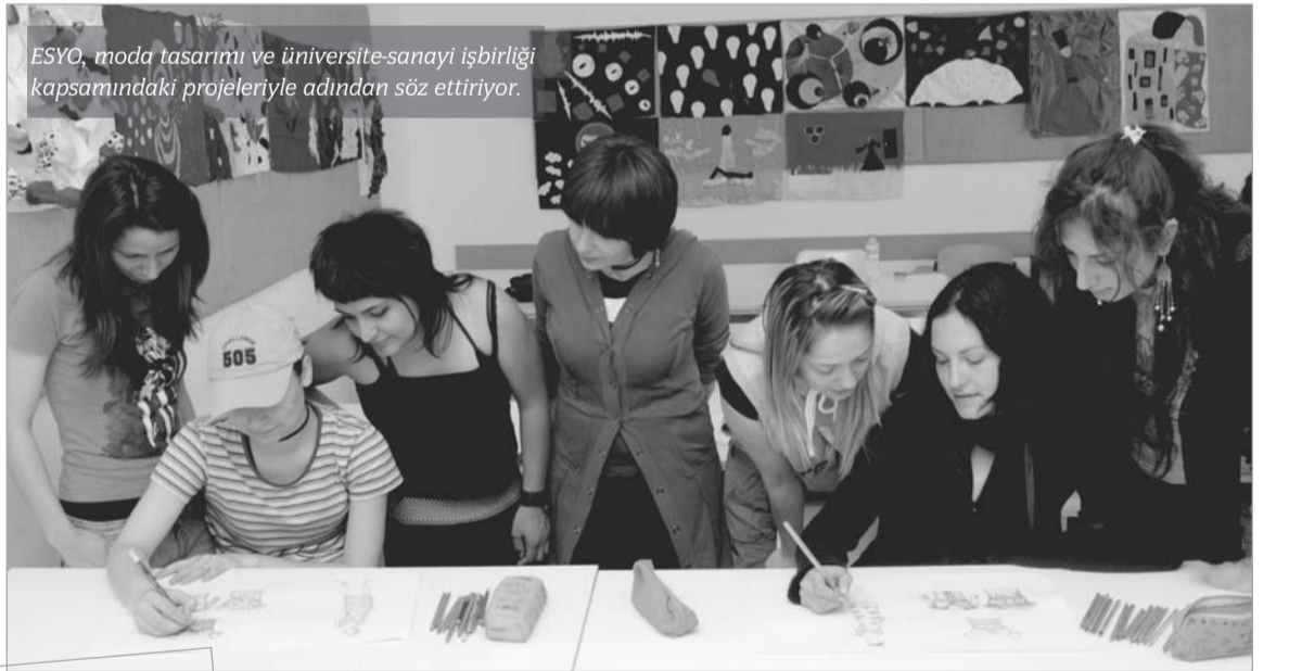
ESYO, moda tasarımı ve üniversite-sanayi işbirliği kapsamındaki projeleriyle adından söz ettiriyor.

Gelişmiş bilgisayar laboratuvarlarında endüstriyel alanlarda ve dünya standartlarında kabul gören yazılımların kullanıldığı yüksekokulda, ulusal ve uluslararası kurum ve kuruluşlarla işbirliği yaparak dünya pazarının gerek duyduğu, teknik ve estetik alt yapıyla donanımlı, nitelik-