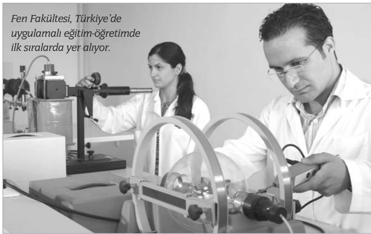
Fen Fakültesi, Türkiye'de uygulamalı eğitim-öğretimde ilk sıralarda yer alıyor.

Fen Fakültesi'nin amacı; ileri teknoloji ile donatılmış laboratuvar ve dersliklerde, biyoloji, fizik, istatistik, kimya ve matematik alanlarında; akılcı, kendine güvenen, sorgulayan ve araştıran uzmanlar yetiştirmek. Fakülte'nin bütün bölümlerinde 1 yıl zorunlu ya-