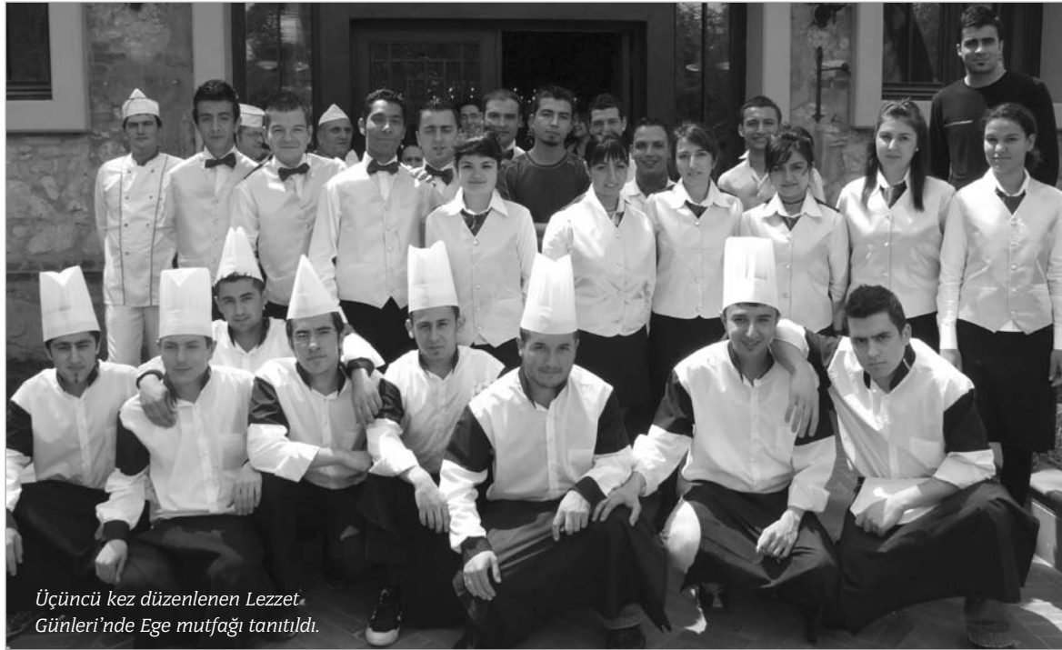
Üçüncü kez düzenlenen Lezzet Günleri’nde Ege mutfağı tanıtıldı.