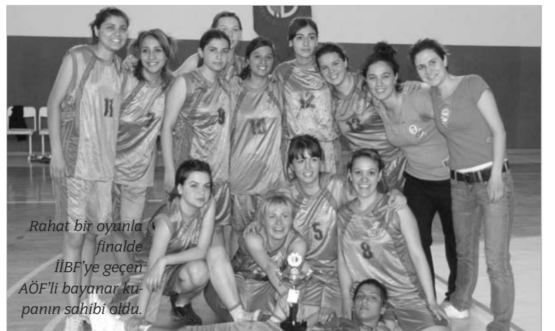
Rahat bir oyunla finalde İİBF'ye geçen AÖF'li bayanlar kupasının sahibi oldu.