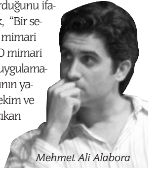
Mehmet Ali Alabora

Mehmet Ali Alabora ise filmin politik mesajının kendisiyle aynı yerde durduğunu ifade ederek, "Bir senaryo bir mimari projedir. O mimari projenin uygulamasında inşaatın yapılması çekim ve sonuçta çıkan bina da filmidir" dedi.