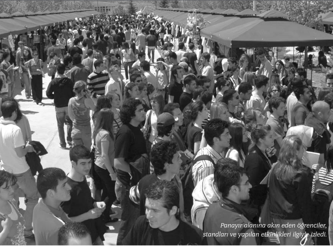
Panayır alanına akın eden öğrenciler, standları ve yapılan etkinlikleri ilgiyle izledi.