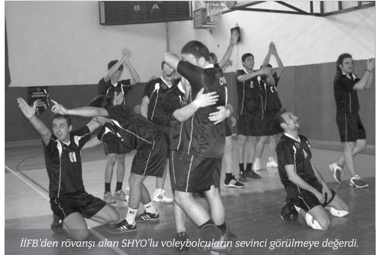
İİBF'den rövanşını alan SHYO'lu voleybolcuların sevinci görülmeye değerdi.