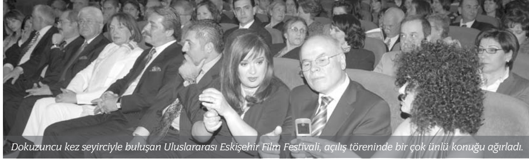
Dokuzuncu kez seyirciyle buluşan Uluslararası Eskişehir Film Festivali, açılış töreninde bir çok ünlü konuğu ağırladı.