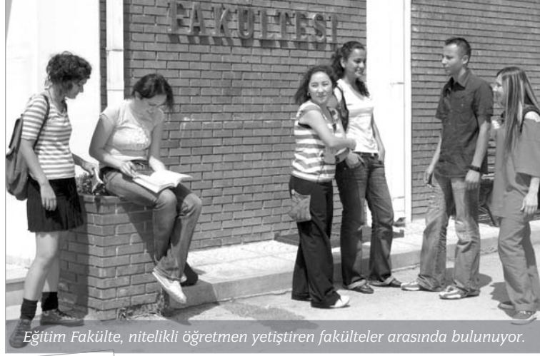
Eğitim Fakülte, nitelikli öğretmen yetiştiren fakülteler arasında bulunuyor.