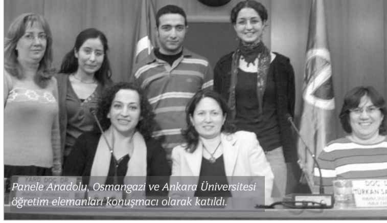
Panelde Anadolu, Osmangazi ve Ankara Üniversitesi öğretim elemanları konuşmacı olarak katıldı.