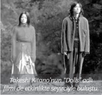
Takeshi Kitano'nun "Dolls" adlı filmi de etkinlikte seyirciyle buluştu.