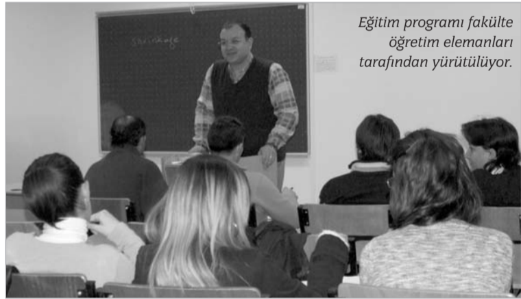
Eğitim programı fakülte öğretim elemanları tarafından yürütülüyor.