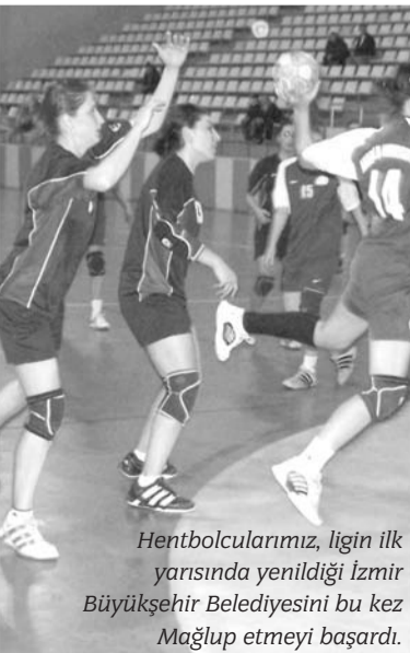
Hentbolcularımız, ligin ilk yarısında yenildiği İzmir Büyükşehir Belediyesini bu kez mağlup etmeyi başardı.