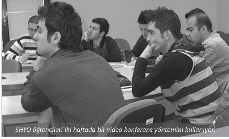
SHYO öğrencileri iki haftada bir video konferans yöntemini kullanıyor.