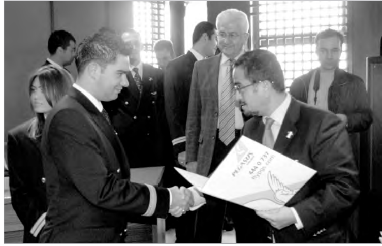
Öğrencilere burs sözleşmeleri törenle dağıtıldı. Törene Pegasus Havayolları Yönetim Kurulu Başkanı Ali Sabancı da katıldı.

18 Kasım günü Rektörlük Senato Salonu'nda düzenlenen törenle öğrencilere burs sözleşmeleri dağıtıldı. Törene, Pegasus Havayolları Yönetim Kurulu Başkanı Ali Sabancı