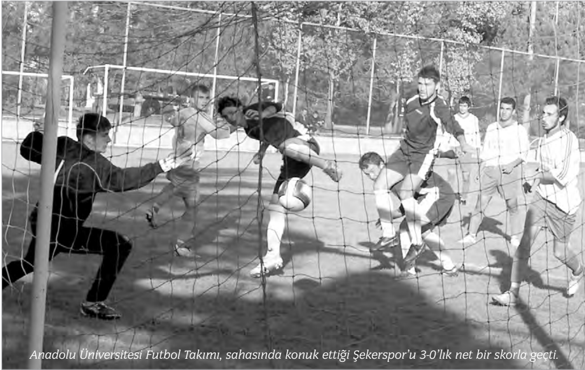
Anadolu Üniversitesi Futbol Takımı, sahasında konuk ettiği Şekerspor'u 3-0'lık net bir skorla geçti.

63. dakikada Sabri ceza sahası dışından nefis bir şut çıkardı ve