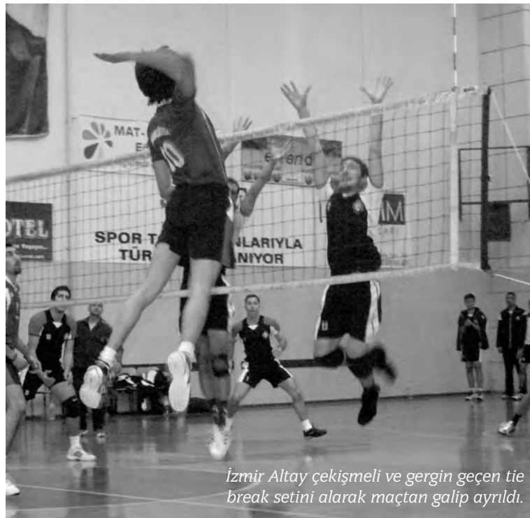
İzmir Altay çekişmeli ve gergin geçen tie break setini alarak maçtan galip ayrıldı.

raftarının da desteğiyle toparlanan Anadolu Üniversitesi, karşılıklı sayılarla geçen setin ilk teknik molasına 8-7 geride giren taraf olsa da mola sonrasında üstünlüğü ele geçirdi. Skoru, setin sonlarında 24-18'e kadar açan Anadolu Üniversitesi, bundan sonra kullandığı 4 set sayısından da puan almayı başaramadı ve skor 24-22'ye kadar geldi. Bu sırada, oyuncularının paniklediğini gören antrenör Önder Öztürk bir mola aldı ve oyuncularının sakinleşmesini sağladı. Mola sonrasındaki ilk oyundan sayı almayı başaran Anadolu Üniversitesi 3. seti kazandı ve setlerde skoru 2-1'e getirdi. Dördüncü sete biraz daha rahat başlayan Anadolu Üniversitesi özellikle Taner ve Serhat'ın isabetli smaçları ile rakibi karşısında üstünlük kurdu. Altay ilk iki setteki etkili oyununu ve üçüncü setteki direncini dördüncü sette gösteremedi. Set Anadolu Üniversitesi'nin 25-16'lık üstünlüğü ile sonuçlandı. Böylece Anadolu Üniversitesi 2-0