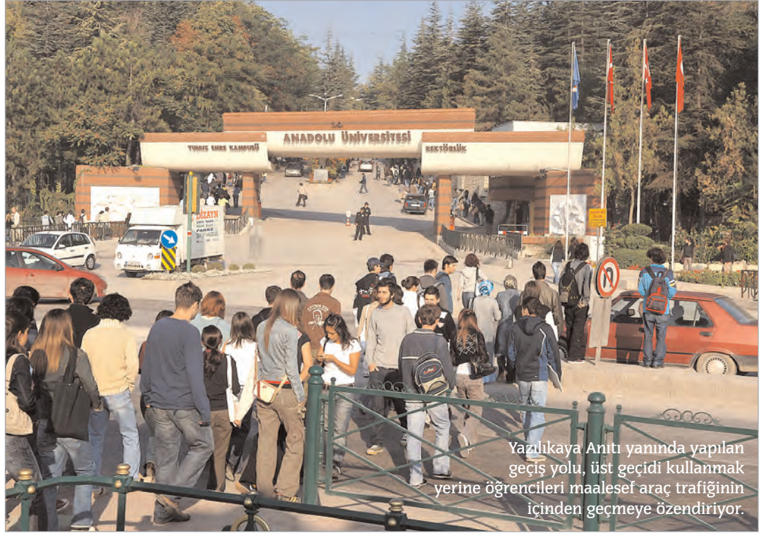
Yazlıkaya Anıtı yanında yapılan geçiş yolu, üst geçidi kullanmak yerine öğrencileri maalesef araç trafiğinin içinden geçmeye özendiriyor.

Öğrenciler, Üniversite Caddesi'ndeki otobüs durağının, çevre yolundaki üst geçidin altındaki şehirlerarası otobüslerin de kullandığı alana alınmasının en mantıklı çözüm olduğunu dile getiriyor. Anadolu Üniversitesi Rektörlüğü de bu çözüme sıcak bakıyor. Öğrencilerin Yunussemre Kampusü'ne ulaşımı çözüm bekliyor. 6. SAYFADA