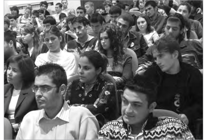
Öğrenciler, ESYO tarafından düzenlenen seminere büyük ilgi gösterdi.