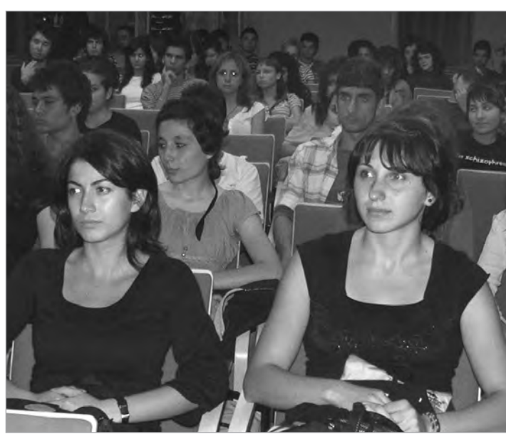
Bilgi ve Zeka Oyunları Kulübü'nün toplantısında FRP tanıtıldı.

Öğretim yılı boyunca devam edecek olan ve iki dönemde gerçekleştirilecek olan Genel İngilizce Gündüz Programı Haziran'a kadar devam edecek. İngilizce Konuşma Programı ve Akademik Yazma Programı'nda ise dersler 25 Ocak 2007 Perşembe günü sona erecek.