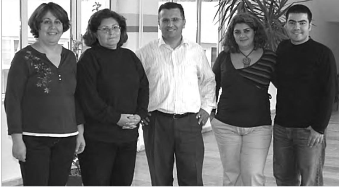
Proje ekibinin çalışmadaki amaçlarından biri de yoksulluğa karşı çözüm önerileri geliştirmek.

Beş öğretim elemanı "Eskişehir'de Çalışan Yoksullar" konulu bir araştırma projesi yürütüyor.