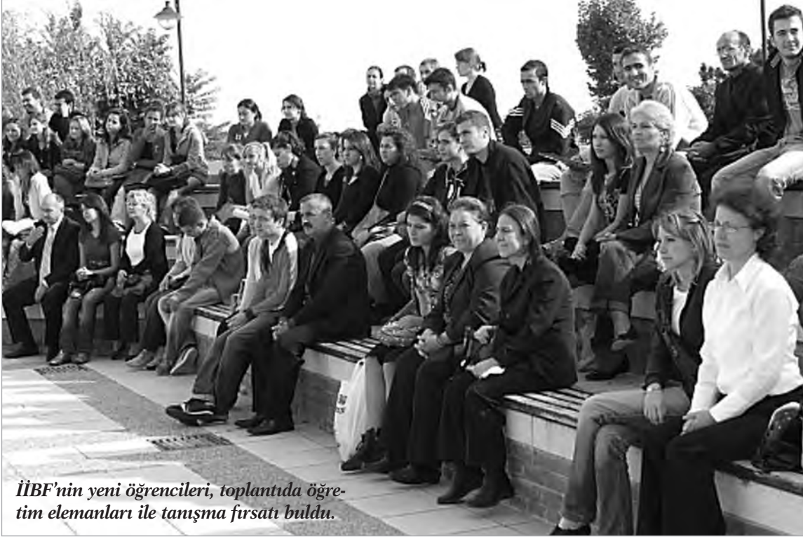
İİBF'nin yeni öğrencileri, toplantıda öğretim elemanları ile tanışma fırsatı buldu.