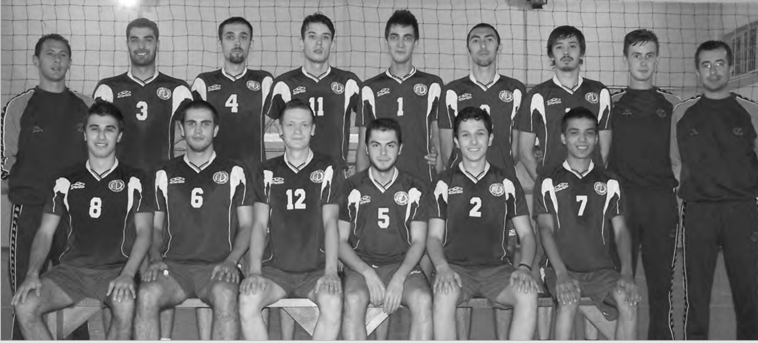
Sezona yeni bir yapılanma ile giren Anadolu Üniversitesi Erkek Voleybol Takımı, güçlenen kadrosuyla şampiyonluk hedefliyor.