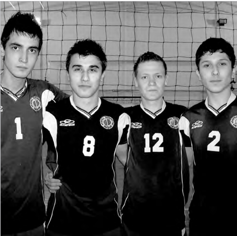
Voleybol takımımız, yeni sezonda zirve yarışında olmak istiyor.