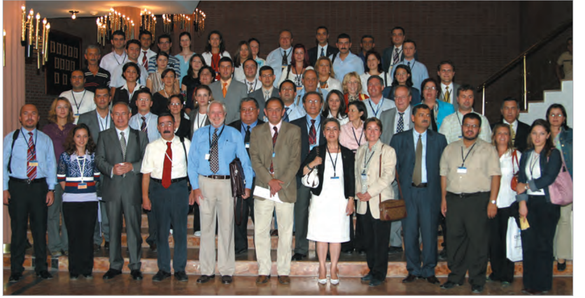
AÖF, düzenlediği sempozyumla üniversitemizdeki en büyük bilim etkinliklerinden birine imza attı.