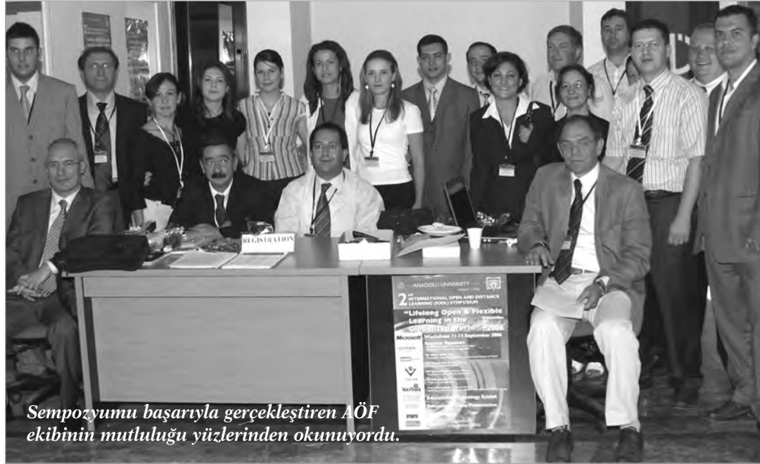
Sempozyumu başarıyla gerçekleştiren AÖF ekibinin mutluluğu yüzlerinden okunuyordu.

"Uluslararası bir organizasyon olan sempozyumun dilinin İngilizce olması ülke içinde katılımları sınırlamış görünse de, sempozyumda açılış konuşmaları, çağrılı konuşmalar ve bir salonda bildiriler sunulari sırasında simultane çeviri imkanı tanındı. Bu uygulama da katılımcıların takdir gördü. Yerli katılımın beklenen düzeyde olmaması, yabancı konuklarda etkinliğin yurt içinde yeterince duyurulmadığı izlenimini yaratmış olsa da, gerek online gerek posta aracılığıyla davetiyeler gönderilerek yerli ve yabancı katılımcılar sempozyum öncesinde davet edildi ve katılıma özendirildi."