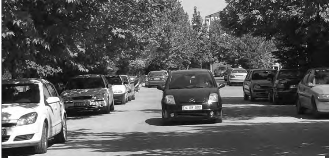
Sürücülerin araçlarını otopark yerine yol kenarlarına park etmesi büyük sıkıntı yaratıyor.

YUNUSEMRE Kampüsü'nün de, rektörlüğün tüm uyarılarına rağmen taşıtları sahipleri araçlarını otoparklar yerine yol üzerine bırakmaya devam ediyor. Üniversitemizde, ana otoparkların yanı sıra her fakülteye ayrılmış park yerlerinin bulunmasına rağmen, araç sahipleri yol üzerine park ettikleri araçlarla kampus trafiğini zorlaştırıyor. Bazı fakültelerin önlerinde bulunan karşılıklı çift sıra halindeki araçlar, kampus trafiğinin en yoğun olduğu saatlerde otomobil kullanıcılarına zor anlar yaşıyor.