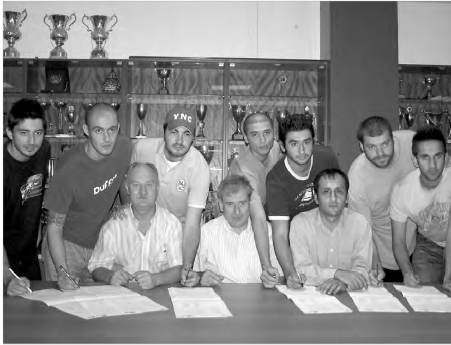
İlk kez Türkiye 2. Basketbol Ligi'nde mücadele edecek olan Anadolu Üniversitesi Basketbol Takımı beş yeni oyuncu ile sözleşme imzaladı.

Hentbolcularımız karşılaşmanın ilk yarısını 15-13 önde kapamasına karşın müsabakadan 31-29 yenik ayrıldı. Karşılaşmanın rövanşı 23 Eylül günü saat 16.00'da Porsuk Spor Salonu'nda oynanacak. Tur için ekibimize en az üç farklı bir galibiyet gerekiyor. Turu geçen takım ikinci turda Sırbistan'ın Knjaz Milos takımının rakibi olacak