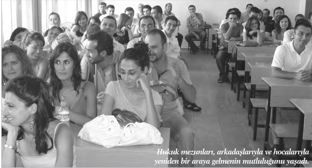
Hukuk mezunları, arkadaşlarıyla ve hocalarıyla yeniden bir araya gelmenin mutluluğunu yaşadı.

Konuşmasında, Hukuk Fakültesi'nin bugün geldiği noktayı da değerlendiren Sürme-