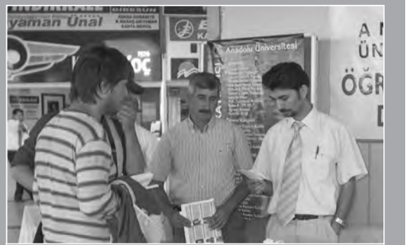
Kayıt Danışma Masaları karşılıyor

KAYITLAR süresince, Eskişehir Demiryolu Garı ile Şehirlerarası Otobüs Terminali'nde "Anadolu Üniversitesi Kayıt Danışma Masaları" öğrencilere yardımcı olmak için hazır bulunacak. Masalarda görev yapacak elemanlar kayıt günleri boyunca 08.00-17.00 saatleri arasında, öğrenciler için danışmanlık hizmeti verecek. Öğrenciler, ayrıca bu saatler arasında Anadolu Üniversitesi'ne ait araçlarla kayıt yaptıracakları birimlere getirilerek, işlemlerini kolayca yapmaları sağlanacak.