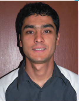
Can UYGUR / EMYO

30 Ağustos her Türk'ün canını dişine takarak savaştığı ve çok büyük zorluklarla kazanılan bir zaferdir. Bugün bu hallere gelebildiysek bunu o günlerde savaşan insanlarımıza ve şehitlerimize borçluyuz. Bu borcumuzu ise ödemediğimizi pek sanmıyorum. Öyle bir gençlik var ki, geçmişinden ve geleceğinden bihaber. Sadece bugünü yaşıyor. Unutmamalıyız ki "Geçmişini bilmeyen milletler, başka milletin avidir."