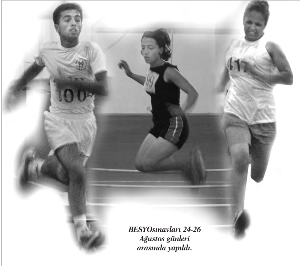
BESYO sınavları 24-26 Ağustos günleri arasında yapıldı.