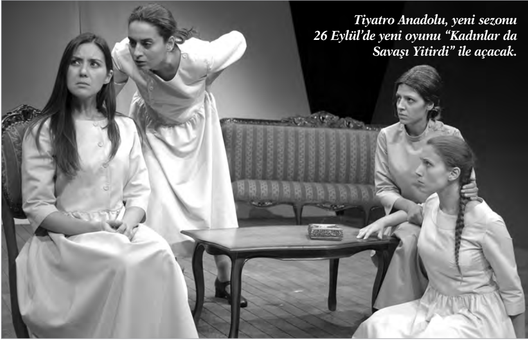
Tiyatro Anadolu, yeni sezonu 26 Eylül'de yeni oyunu "Kadınlar da Savaşı Yitirdi" ile açacak.