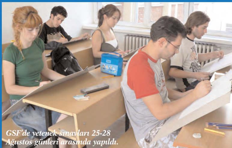
GSF'de yetenek sınavları 25-28 Ağustos günleri arasında yapıldı.

Anadolu Üniversitesi'nin önkayıt ve yetenek sınavıyla öğrenci alan bölümlerinde sınav heyecanı yaşanıyor. Güzel Sanatlar ve Eğitim Fakültesi ile Devlet Konservatuvarı, Beden Eğitimi ve Spor Yüksekokulu'nda sınavlar tamamlandı ve kazananlar belli oldu. Sivil Havacılık Yüksekokulu'nda ise sınavlar devam ediyor. ► 7