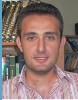
Kenan ÖZKAN / SBE

Köylüsüyle, efendisiyle, sarıklısıyla, kalpaklısıyla, erkeği-kadını, genci-yaşlısı, binlerce Türk'ün var olma mücadelesinin, medeni alemde eşit haklara sahip olarak yaşayabilmesi için verdiği kavganın son adımıdır. Sevr ile birlikte başının kesilerek Anadolu'nun bozkırına atılan bir ulusun bağımsızlık mücadelesinin simgesidir. 30 Ağustos, Yeni Türkiye Cumhuriyeti'nin inşası ve ulusdevlete giden yolun başlangıcıdır.