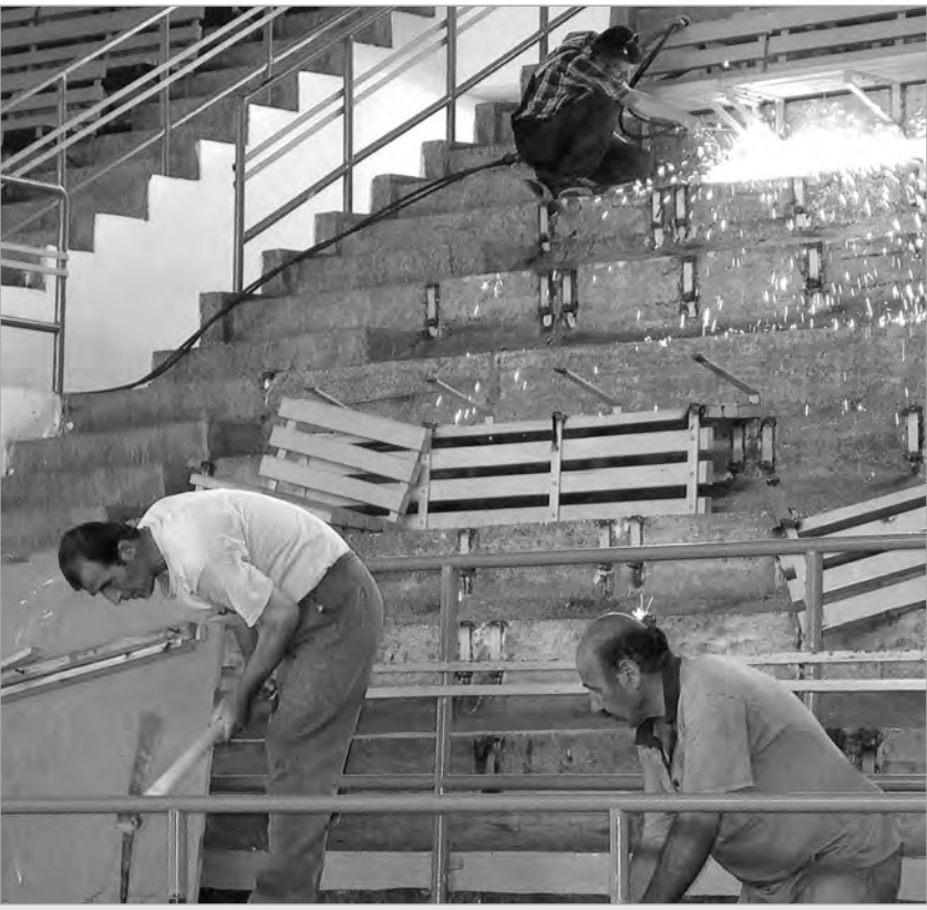
Yunusemre Kampusü Spor Salonu'nun ahşap oturma blokları yerini plastik koltuklara bırakıyor. Medya Merkezi yepyeni bir görünüme kavuşurken, Mühendislik Minarlık Fakültesi'nde de 109 araç kapasiteli bir otopark yapıldı.