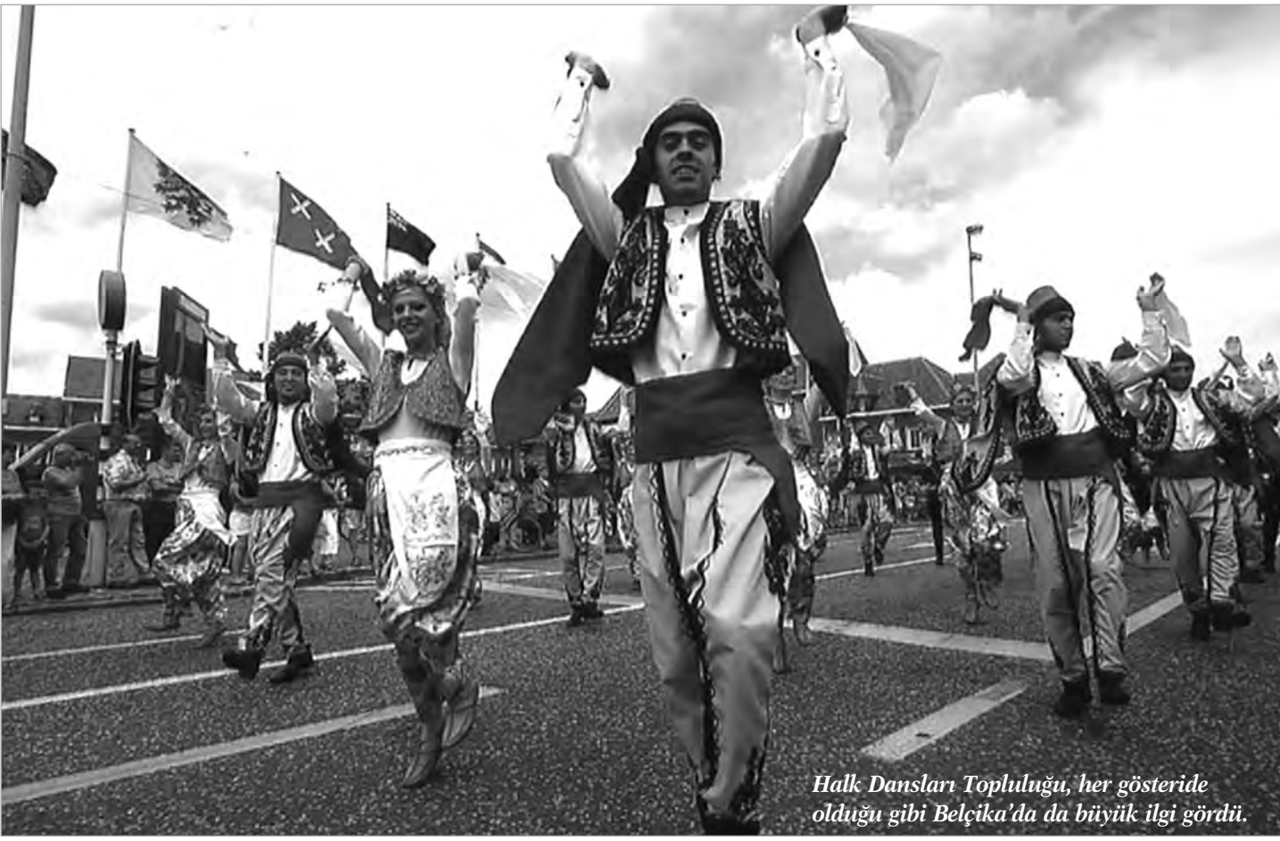
Halk Dansları Topluluğu, her gösteride olduğu gibi Belçika'da da büyük ilgi gördü.