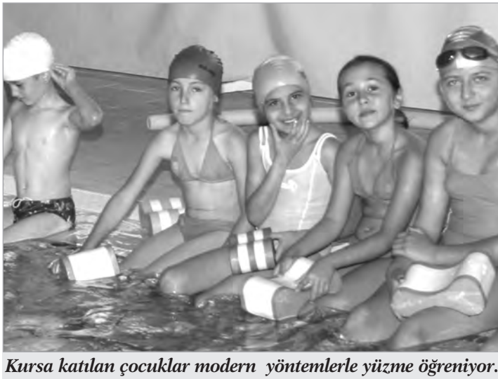
Kursa katılan çocuklar modern yöntemlerle yüzme öğreniyor.

Burada çocuklar hem yüzme hem de grup dinamiğini öğreniyor. Çocuklara öncelikle, eskiden kalma dereye atma gibi yöntemlerle değil, su korkusunu yaşamadan suya alışmasını sağlayarak yüzme