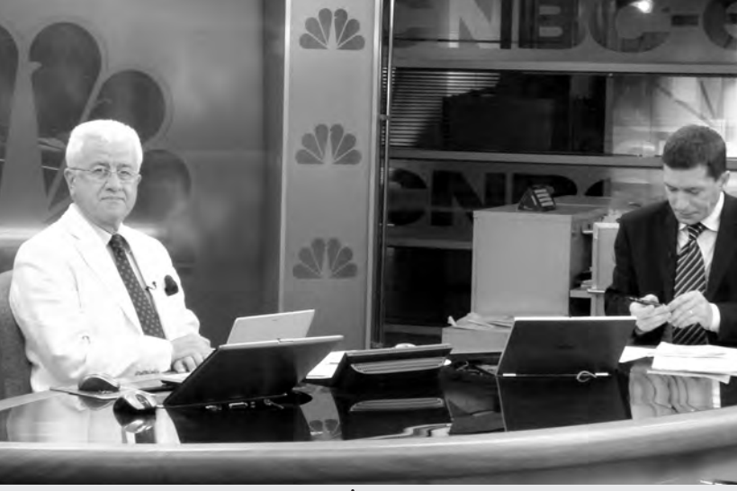
Rektör Prof. Dr. Fevzi Sürmeli, İngilizce hazırlık eğitiminin Anadolu Üniversitesi öğrencileri için büyük bir avantaj oluşturduğunu söyledi.

Özellikle yabancı dil eğitimine büyük önem verdiklerini ifade eden Sürmeli, bu eğitimin öğrencilerimize ve mezunlarımıza büyük bir avantaj sağladığını kaydetti. Anadolu Üniversitesi'ne örgün olarak gelen 3 bin öğrencinin 2 bin 500'üne yabancı dil