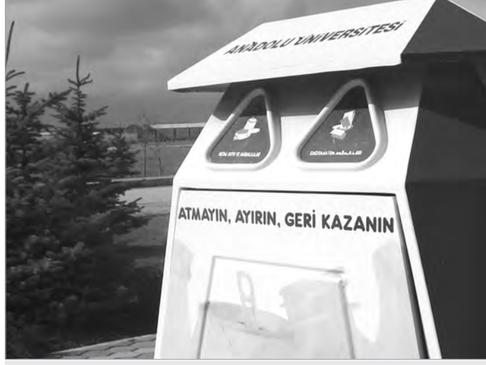
Proje, Doğa ve Çevre Kulübü ile birlikte yürütülüyor.