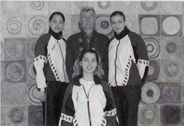
Anadolu Üniversitesi'nin eve sahipliği yaptığı eskrim müsabakalarında bayan epe takımımız, gümüş madalya kazandı.

kategorisinde B kategorisinde yerli. Bayan ve erkek kros takımlarımız da Türkiye birinciliğini istedikleri dereceleri elde edemediler. Bayan takımımız, 11 ekip arasında 10'unculuğa kalırken, erkek takımımız 5 ekip arasında yarışmaları son sırada tamamladı.