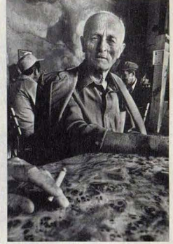
Merter Oral'ın "28 Portre" adlı sergisinden bir çalışma

Günün diğer bir etkinliği de, ülkemizin tanınmış foto muhabirlerinden Kutup Dalgıçkan'ın "Çingene, Bizzaz Bahadır" gösterisi ve söyleşisi oldu. Gösteride, Dalgıçkan'ın, İstanbul'un Küştepe mahallesindeki Romanlarla geçirdiği uzun zaman ve röportajlar, bir saydam gösterisiyle beğenildi. Aynı gün Kongre Merkezi'nde Kemal Cengizkan'ın "Şehirden Portreler" adlı saydam gösterisi de fotoğraf severlere buluştu. Fotoğraf Haftası, pazartesi günü ESD-Ü Sanat Galerisi'nde açılış yapılan "Recent