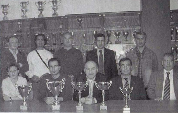
Branş sorumluları ve antrenörler Üniversite Oyunları'nda kazanılan kupalarla poz verdi.