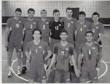
Voleybol erkek takımımız, A kategorisinde ilk yılında dördüncülüğü elde etti ve gelecekteki yıl aynı kategoride mücadele etmeye hak kazandı.

TÜRKİYE 1. Bayanlar Voleybol Ligi'ne yükselme karşılığın Ankara Selim Sırrı Tarcan Spor Salonu'nda oynandı. Anadolu Üniversitesi bayan voleybol takımı, ilk maçında Samsun DSİŞ'e 3-2 yenildi. Karşılaşma 2-2 devam ederken Anadolu Üniversitesi, tie-break setinde 14-10 üstünken seti 17-15 kaybederek büyük bir şok yaşadı. İkinci maçında takımımız İskenderun Demirspor karşısında 1-0 öne geçti. İkinci sette Natalia'nın sakatlanmasıyla büyük bir sansizlik yaşayan ekibimiz karşılaşmadan 3-1 yenik ayrılarak 1. Lig'e çıkma şansını kaybetti. Bayan voleybolcularımız son maçında da Polisan Değirmentepe'ye 3-2 mağlup olarak final grubunu son sırada tamamladı.