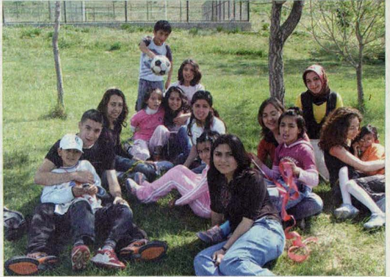
Gönüllü Toplumsal Hizmetler Kulübü Anneler Günü'nde kimsesiz çocukları yalnız bırakmadı