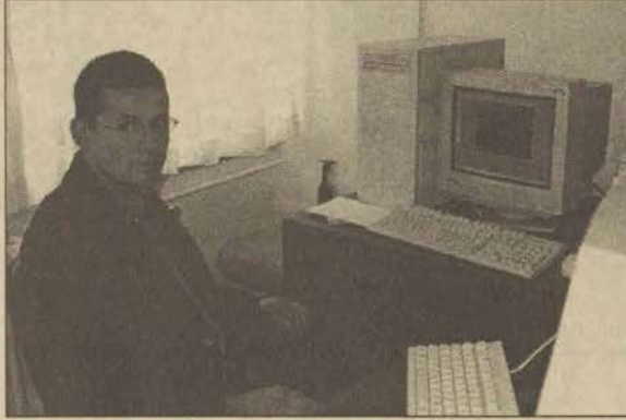
Sınav sorularının hazırlandığı soru bankası bilgisayarı

Tokbudak, sınav sorularının hazırlanmasında üç aşama olduğunu anlatarak, bunların ham soru yazımı, eğitim-öğretim tekniği açısından değerlendirme ve bilimsel redaksiyon aşamaları olduğunu söyledi. Bu aşamalardan geçen soruların Birim'deki bilgisayarların oluşturduğu soru bankasında dijital ortama aktarıldığına değinen Tokbudak, bunun için grafik ve yazı işleyebilen bir bilgisayar yazılımının, Birimin kuruluş aşamasında Mimarlık-Mühendislik Fakültesi'ndeki öğretim üyeleri tarafından yazıldığını belirtti.