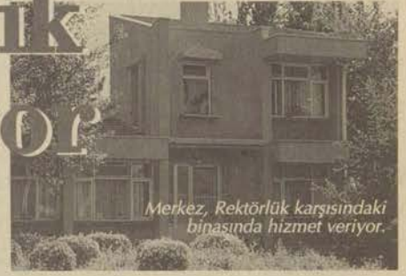
Merkez, Rektörlük karşısındaki binasında hizmet veriyor.