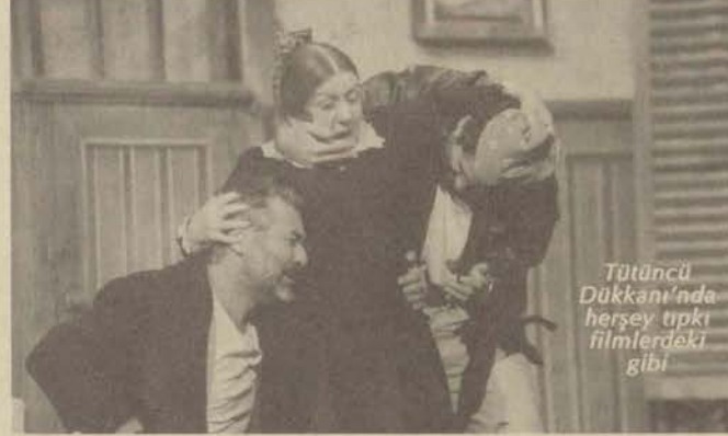
Tütüncü Dükkanı'nda her şey tıpkı filmlerdeki gibi

oyun Türkiye'de ilk kez sahneleniyor. Buradaki ilgiden çok memnun kaldık, bununla salonun dolmasını kastedmiyorum; izleyicilerin oyuna reaksiyonları çok iyi." dedi.