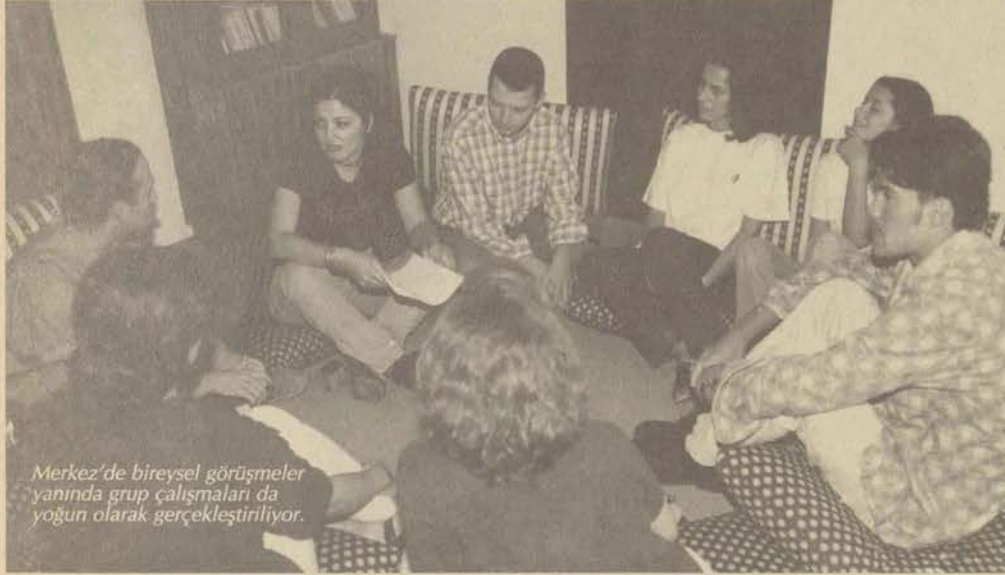
Merkez'de bireysel görüşmeler yanında grup çalışmaları da yoğun olarak gerçekleştiriliyor.

Günümüzde bilimsel ve teknolojik gelişmeler, toplum yapısında da kültürel ve sosyal değişimlere neden oluyor. Toplumsal değişimin sonucu olarak, varolan değer yargıları önemini kaybederken yeni değer yargılarının yerine konması çoğu zaman zor olmaktadır. Bu süreçte gençlerin ortaya çıkan sorunlarla mücadele edebilecek ve çevrelerine uyum gösterebilecek kimseler olarak yetişmeleri gereği daha çok hissediliyor.