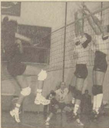
Anadolu Üniversitesi Bayan Voleybol Takımı dicle Üniversitesini mağlup etti.

► İki üniversitenin zorlu mücadelesinde gülen takım Anadolu Üniversitesi oldu. 6 Aralık'ta Atatürk Spor Salonu'nda oynanan maçı Ana. Ü. 3-0 kazandı.