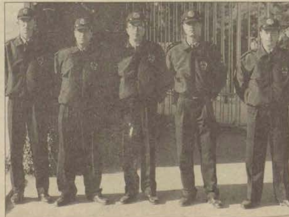
Güvenlik görevlileri artık hizmetlerini yeni üniformaları ile sürdürecekler

Güvenlik görevlileri dışında kalan eski koruma ve güvenlik görevlisi olduğu, bunlara kadro alınmadığı için, kadroları alınca onlara da üniforma verileceği belirtildi.