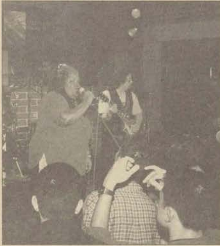
Gitarda ve vokalde kendi orijinal stiliyle tanınan Son Seals, dinleyicilere müzik ziyafeti verdi.

► Efes Pilsen'in düzenlemiş olduğu "Efes Pilsen Blues Festival 9" kapsamında verilen konserlerin Türkiye'deki son durağı Eskişehir Hayal Kahvesi'nde gerçekleşti.