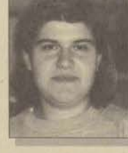
Eğt. Fak. Almanca Öğretmenliği

Almanca öğretmeni olmak için gelmişim bu okula, ama olamıyacağım çünkü sistem "Olamazsın, ben seni İlköğretim Sertifika Programı ile