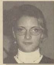
Eğt. Fak. İngilizce Öğretmenliği

Geleceğin öğretmenleri olarak bizler herşeyden önce çağın gerektirdiği gibi bir eğitim sistemi oluşturmalıyız. Bu sistem sadece bilgi yükü değil öğrencinin duygu, düşünce ve yeteneklerine hitap etmelidir. Geleceğin öğretmenleri olarak bunu başaracağımızdan eminim.