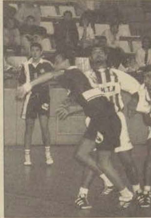
Erkek hentbolcular Seyhan galibiyetiyle ligdeki iddialarını sürdürdüler