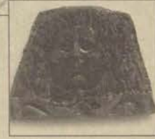
Eskişehir Arkeoloji Müzesi'nde, 1945 yılından buyana, çevre yerleşim yerlerinden bulunan ve derlenen eserler sergileniyor.

ğının denetim ve gözetimi altında. Bu yasa çerçevesinde ancak çok gerekli koşullarda arkeolojik sit alanlarından fiziksel bir takım değişimlere gidilebiliyor. Değişim koşullarının oluşmasındaki ölçütleri ise çok sağlıklı bir biçimde saptamak gerekiyor.