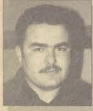
Eğt. Fak. Fransızca Öğretmenliği

İkibinli yıllara yaklaştığımız şu günlerde eğitim sistemi tam bir kargaşa içerisine girmiştir. Geleceğin öğretmenleri olan biz gençlerin