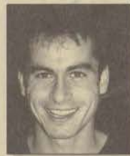
Eğt. Fak. Fransızca Öğretmenliği

En büyük sorun, ciddi eğitim ve öğretim yaptıklarım zanneden ciddi-yetten uzak yeteneksiz öğretmenlerdir. Öğretmenlik 2x2'yi öğretmek değildir. Aynı zamanda bir insana iyi eğitim vermektir. İnsan ilişkilerini öğretmek, insanda insani değerleri geliştirmek ilk prensip olmalı. Öğretmen maki-