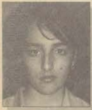
Eğt. Fak. Sınıf Öğretmenliği

Geleceğin bir öğretmen adayı olarak ilk önce eğitim sistemindeki eşitsizliğin ortadan kalkmasını isterim. Her yerde öğrencilere aynı