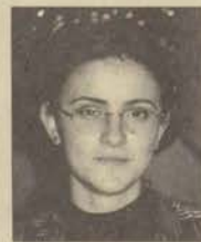
Eğt. Fak. Sınıf Öğretmenliği

Öğretmen adayı olarak daha yolun çok başındayım. İyi bir öğretmen olabilmem için kendimi iyi yetiştirmem gerekiyor.