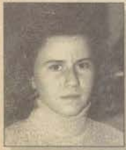
Eğt. Fak. Almanca Öğretmenliği

Her yıl Eğitim Fakültelerinden yüzlerce öğretmen mezun oluyor. Acaba bunların kaç tanesi öğretmenlik yapıyor biliyor musunuz?