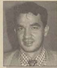
Eğt. Fak. Zihin Engelliler Öğretmenliği

Geleceğin öğretmeni ne düşünüyor ilginç! Aslında günümüzde bazılarına göre öğretmenin ne düşündüğü değil sistemin