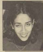
Eğt. Fak. Matematik Öğretmenliği 4

Genç bir öğretmen adayı olarak eğitim sistemimizin çok sağlıklı bir altyapısı olduğuna inanmıyorum. Ezberci ve gereksiz bilgi yoklama anlayışından sıyrılarak daha analitik düşünebilen insan yetiştirilmesi gerektiği kanısındayım. Umarım bu engeller kısa sürede aşılır.