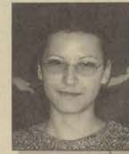
Eğt. Fak. Güzel Sanatlar Böl. 4

Geleceğin bir öğretmen adayı olarak aldığım eğitimin, iyi bir öğretmen olmam için yeterli olmadığını düşünüyorum. Eğitim Fakül-