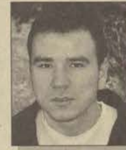
Eğt. Fak. Almanca Öğretmenliği 4

Geleceğin öğretmenleri ne düşünebilir ki? İlk öğretilerimiz yıllarda neredeyse sokaktan çevirdiğimiz insanları herhangi bir üniversite diploması var diye öğretmen yapmadık mı? Böyle bir durumda bu öğretmenlerle bu iş yürür mü? Öğretmenliği gerçekten bu işi sevenler, istekli kişiler yapmalı. Bu meslek öyle sanıldığı gibi kolay değil. Herkes öğretmenlik yapamaz, yapmamalı. Aksi takdirde eğitim sisteminden hiçde umutlu değilim. Hiçkimsenin de umudu olmamalı. Zira bu tür bir eğitim sistemi ile bir sonuca varılamaz.