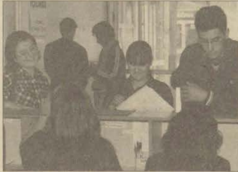
AÖF Büroları 28 Kasım ve 5 Aralık Cumartesi günleri de öğrencilere hizmet verecek.

► Anadolu Üniversitesi'nin uzaktan öğretim sistemiyle eğitim veren fakültelerinde kayıt yenileme işlemleri 23 Kasım 8 Aralık 1998 tarihleri arasında 77 merkezde yapılacak.