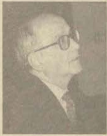
Prof. Dr. Mümtaz Soysal yaptığı konuşmada Cumhuriyetimizi farklı kılan özelliklerini anlattı.