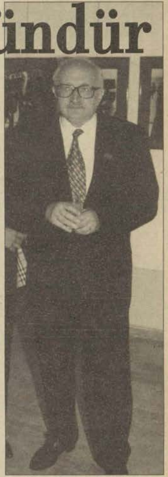
Hanri Benazus Atatürk'ün Ağzından Atatürkçülük söyleşisinin ardından Hanri Benazus'un Atatürk Fotoğrafları adlı sergisini açtı.

Konferansın ardından Hanri Benazus'un Atatürk Fotoğrafi adlı sergisi Kütüphane ve Dökümantasyon Merkezi Sergi Salonu'nda Atatürkçü insanlarla buluştu. 100'ü aşkın sergisi olan Benazus'un sergisinde 250-300 Atatürk fotoğrafı sergileniyor. Halen de, İzmir, İstanbul ve Ankara'da sergileri devam ediyor.