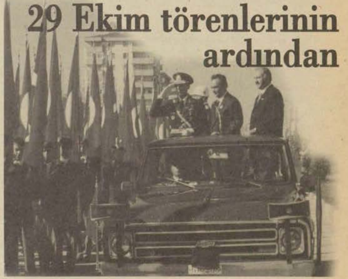
Bu yıl 75. yaşına giren Cumhuriyetimiz tüm yurttaki olduğu gibi Eskişehir'de de büyük bir coşku ile kutlandı.