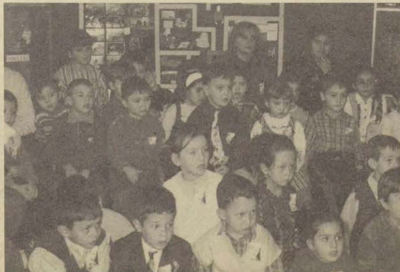
Kendi süsledikleri sınıflarda cumhuriyet sevincini yaşayan çocuklar, etkinliklerini hep bir ağızdan söyledikleri 10. Yıl Marşıyla tamamladılar.

► Yediden yetmişe tüm ülkeyi saran cumhuriyet coşkusu Anadolu Üniversitesi Çocuk Yuvası'ndaki miniklerin de katılımıyla daha da renklendi.