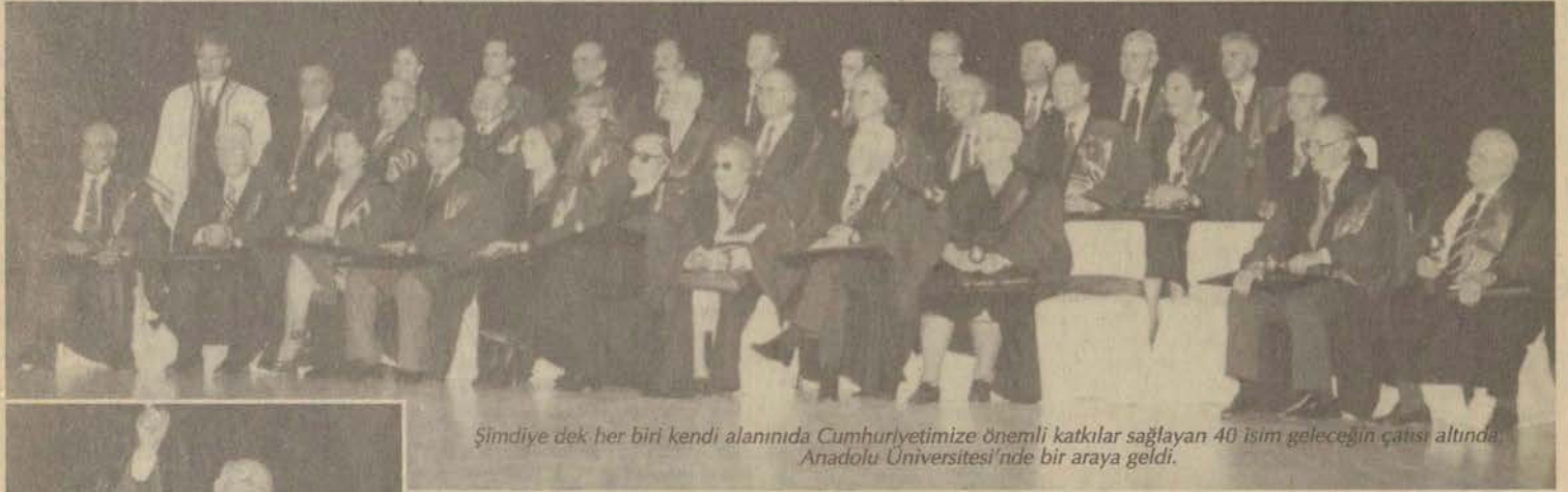
Şimdiye dek her biri kendi alanında Cumhuriyetimize önemli katkılar sağlayan 40 isim geleceğin çatısı altında Anadolu Üniversitesi'nde bir araya geldi.

Fahri doktorumuz Cumhurbaşkanı Süleyman Demirel: