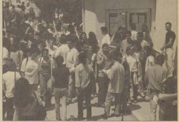
Üniversiteyi kazanamayan öğrenciler, ek kontenjandan yararlanarak bir yüksek öğretim kurumuna kayıt yaptırabilecek.

Anadolu Üniversitesi'nden yapılan açıklamaya göre, öğrencilerin, Üniversite'nin Cumhuriyet Müzesi'nde bulunan ÖSYM Bürosu'ndan, 600 bin TL karşılığında başvuru klavuzu alarak kayıt yaptırabilecekleri bildirildi. Kesin kayıtların ileri bir tarihte yapılacağı belirtildi.