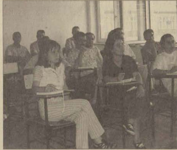
Öğretim elemanlarının yabancı dil seviyesini yükseltmek amacıyla Hizmetiçi Yabancı Dil Eğitim Merkezi'nde bu yıl da İngilizce, Almanca ve Fransızca kursları düzenleniyor.

Bu kurslardan yoğun programlı sınıflar akademik ders yılı sonunda, diğer sınıflardaki öğretim elemanları ise başarılı oldukları takdirde 10 Kasım'da kursları sona erecek. Başarılı olamayan öğretim elemanları ise 10 Mayıs'taki sınava kadar kursa devam edecekler.