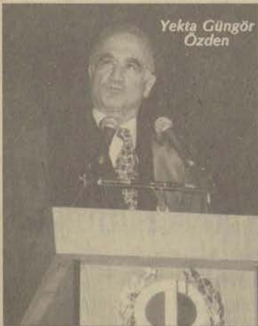
Yekta Güngör Özden