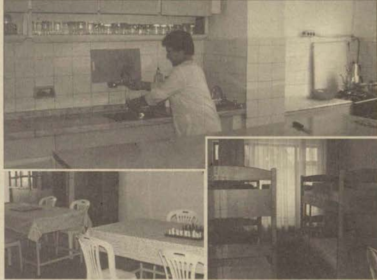
Eskişehir'de öğrenciye hizmet veren özel yurtlarda, bir öğrencinin ihtiyaç duyabileceği temel hizmetlerin karşılanmasına çalışılıyor. Ayrıca öğrencilerin yanısıra, sosyal ihtiyaçlarını da karşılayabilecekleri, TV izleme odası, etüd salonları ve misafirhane gibi bölümler de bulunuyor.

Yurtların, MEB denetiminde olması, yurtlarda hizmet açısından bazı zorunlulukları da beraberinde getiriyor. Bu yükümlülüklerden birkaçı şöyle; bir öğrenci için en az 4 metrekaarelik alanı bulunan yatakhane, 15 öğrenci için en az bir adet wc, 25 öğrenci için en az bir banyo v.b.