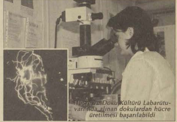
Hücre ve Doku Kültürü Laboratuvarı'nda alınan dokulardan hücre üretilmesi başarılı oldu