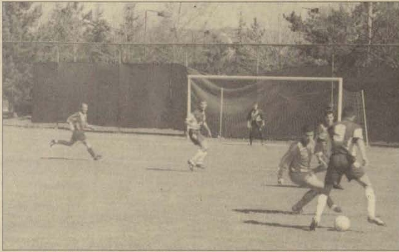
Anadolu Üniversitesi Futbol Takımı Fatihspor engelini 9-2 gibi farklı bir skorla aştı