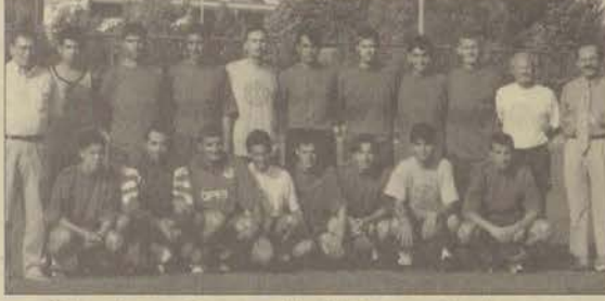
Anadolu Üniversitesi Futbol Takımı idarecileriyle birarada

Amatör 1. Lig'te mücadele eden Anadolu Üniversitesi Futbol Takımı zorlu ekip Essuspor'u 2-1'lik skorla geçerek ligin dördüncü haftasına namağlup olarak girdi.