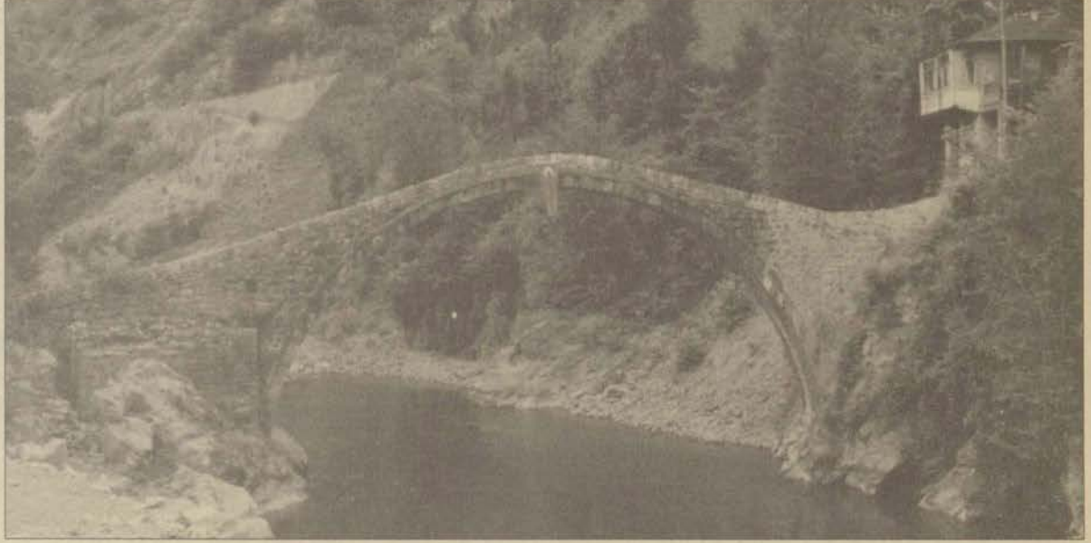
Fırtına Deresi üzerine kurulmuş taş köprülerden birisi olan Köprüköy'ün korkuluklarla birlikte genişliği 2.90 metre. Köprü 100 yıl önce Türk ustalar tarafından yapılmıştır.

■ Çalışmanın ilk basamağını oluşturan Rize köprülerinin fotoğraflanması ve mimari profillerinin çıkarılması için ekip, 19 Eylül'de Rize'ye gidiyor.