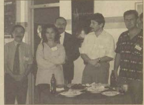
Kurs öğrencilerinin tanışması için kokteyl verildi

perşembe günleri saat 14:00-17:30 arasında yapılacak. Program haftada 12 saat uygulanacak. Almanca KPDS hazırlık programı haftada 10 saat uygulanacak ve hafta içi pazartesi, salı çarşamba ve cuma günleri, 16:00-17:30 saatleri arasında yapılacak. Haftada 8 saat olarak belirlenen Fransızca KPDS hazırlık programı, pazartesi, salı, çarşamba ve perşembe günleri 16:00-17:30 saatlerinde yapılacak. Başvuruda bulunacakların, 1 akademik personel kartı fotokopisi ve bir vesikalık fotoğrafla Hizmetiçi Yabancı Dil Eğitim Merkezi'ne başvurumaları gerekiyor. Adaylar, 18 Eylül 1998 Cuma günü saat 14:00'de düzey belirleme sınavına alınacaklar.