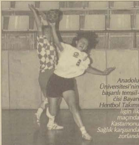
Anadolu Üniversitesi'nin başarılı temsilcisi Bayan Hentbol Takımı ligin ilk maçında Kastamonu Sağlıkspor'u mağlup etti

Erkeklerde ise Kılıçoğlu Toprakspor, İstanbulspor, Diyarbakır Polisgücü ve Kastamonu DSİ mücadele etti. Diyarbakır Polisgücü bu turnuvada rakiplerini geçerek birinciliğe uzandı.