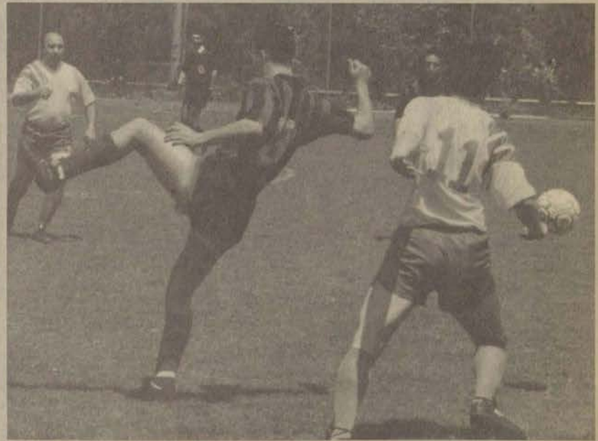
Maça hızlı başlayan ve ilk golü atan İ.B.F.'nin nefesi yetmedi

73. dakikada Tanık'ın uzun pasına hareketlenen Murat'ın vuruşu ağlara gitti ve maç 7-1 sona erdi.