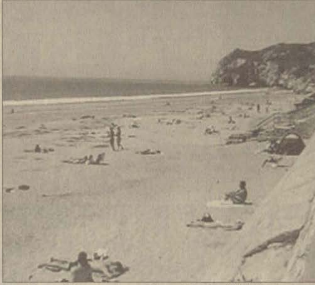
Durgun bir sezon yaşayan Ege ve Akdeniz sahilleri dört gözle Dünya Kupası'nın bitmesini bekliyor.

Türkiye'nin en önemli gelir kaynaklarından bir tanesini oluşturan turizm sektöründe yaz sezonundaki hareketlilik, beklentilerin altında kaldı. Özellikle Dünya Kupası'nın başlaması ve Yunanistan'daki devalüasyon ülkemize gelen yabancı turist sayısında azalmaya yol açtı. Bu durum da fiyatların saptanmasında ve rezervasyonlarda belirsizliklere neden oluyor. Ayrıca Türkiye'deki turizm kalitesinin yükselmesine bağlı olarak fiyatların artması da yabancı turist sayısındaki azalmanın bir başka nedeni olarak gösteriliyor. Öte yandan hava sıcaklığının mevsim normallerinin altında seyretmesi ve okulların henüz tatile girmemesi gibi etkenlerin de yerli turistlerin sayısında azalmaya neden olduğu belirtiliyor. Bununla birlikte turizmciler bu durumun yaz boyunca sürmeyeceğini ve özellikle Temmuz ayının ortalarından itibaren ülkemizdeki doluluk oranının yeniden artacağını kaydediyorlar.