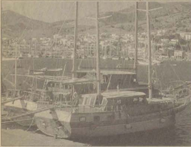
Her yıl yüzlerce teknenin konakladığı Bodrum Marinası sakin günler geçiriyor.