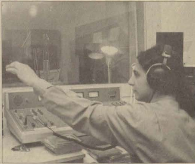
Radıyo A yaz döneminde de dinleyicileri ile buluşmaya devam edecek