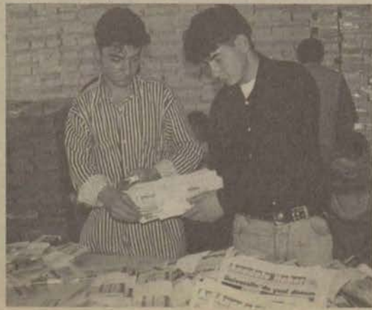
Anadolu Haber'in 650 bin açıköğretim öğrencisine ulaştırılması için çalışmalar sürüyor

Daha önce Açıköğretim öğrencilerine Açıköğretim Bülteni gönderilmekteydi. Bundan böyle Anadolu Haber, Açıköğretim öğrencilerinin de gazetesi olacak.