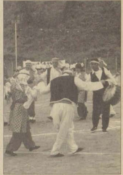
Anadolu Üniversitesi Turizm Uygulama ve Araştırma Merkezi'nin folklor ekibi