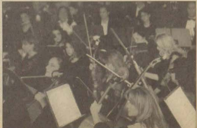
Ankara Devlet Opera ve Balesi Orkestrası seyircileri büyüledi.