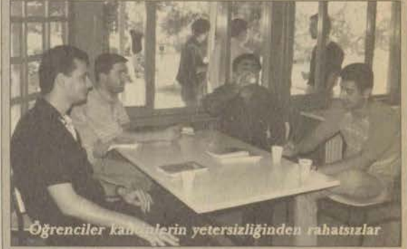
Öğrenciler kantinlerin yetersizliğinden rahatsızlar

Öğrenciler, ders dışı zamanlarını geçirdikleri okul kantinlerinden memnun değil. Kampus hayatında oldukça önemli bir yer sahip olan kantinlerdeki farklı uygulamalardan ve eksikliklerden dolayı rahatsızlık duyduklarını belirten öğrenciler, özellikle öğle tatillerinde okul kantinlerinden gereğince faydalanamadıklarını söylediler.