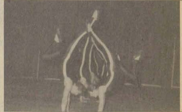
BESYO öğrencileri yer akrobasi gösterilerini sergilerken