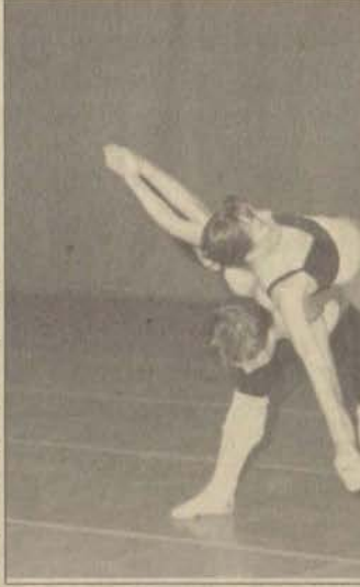
Devlet opera ve Balesi Dansçıları prova sırasında

Renkli dans figürleriyle yüklü gösteri izleyicilerin yoğun ilgisini