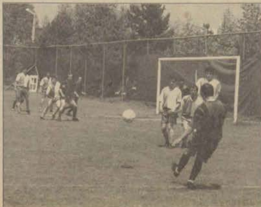
Personel-Yapı İşleri karşılaşması berabere sonuçlandı.