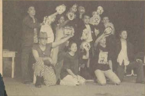
Etkinlikler "Delirilenler" adlı bir perdelik oyunla başladı.

Bugün birçok büyük şehrin sorunu olan toplu taşımacılık konusunda belediyemizin yeni bir alternatif oluşturmasının gerekli olduğunu düşünüyorum. Çünkü gelecekte belediye ve halk otobüsleri bu ihtiyacı karşılayamayacak. Umarım belediyemiz gelecek dönemler için bu konuyla ilgili bir altyapı çalışmasını başlatır.