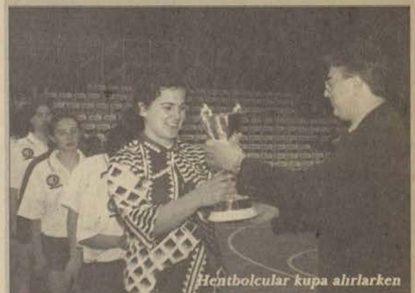
Hentbolcular kupa alırken