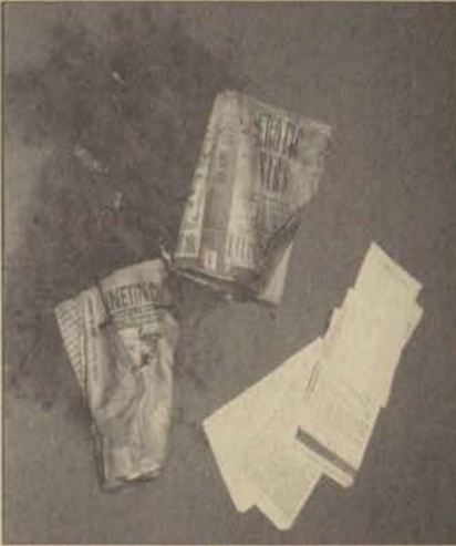
Tuvaletin rezervuarından ve içinden çıkan kitaplar

Rezervuarların içinden klasik eserler çıkardıklarını belirten Yılmaz, geçen yıl 475 bin kişinin kütüphaneden yararlandığını söyledi. Adnan Yılmaz, Merkezin, günde 2500 ila 9000 kişiye hizmet verdiğini vurguladı. Kütüphane kullanıcılarının bilinçli olması gerektiğine dikkat çeken Yılmaz, "Bugün sizin okuduğunuz kitabı yarın bir başkası kullanacak. Pazar günleri 12.00 ile 16.00 arasında diğer günler ise 22.00'ye kadar durmaksızın hizmet sunan kütüphanemizde bu tür olayların yaşanmamasını diliyorum" diye konuştu.