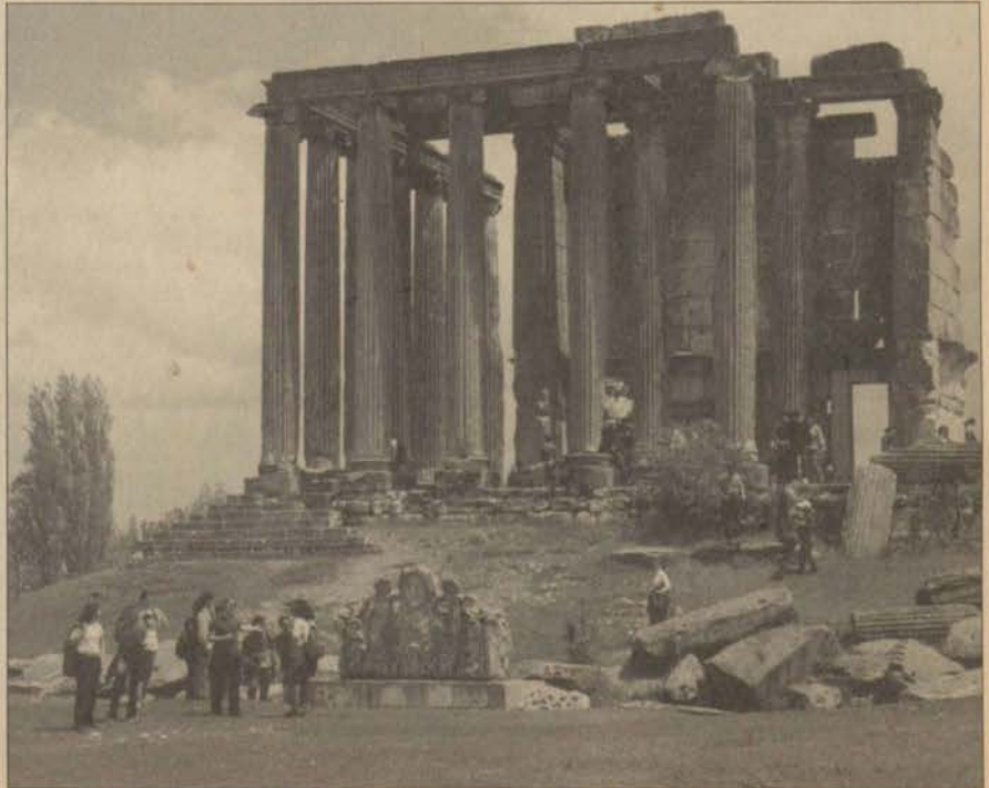
Aisonai'ye yapılan trekking gezisinde tarihi yerler de ulaşılması planlanan hedeflerden biriydi