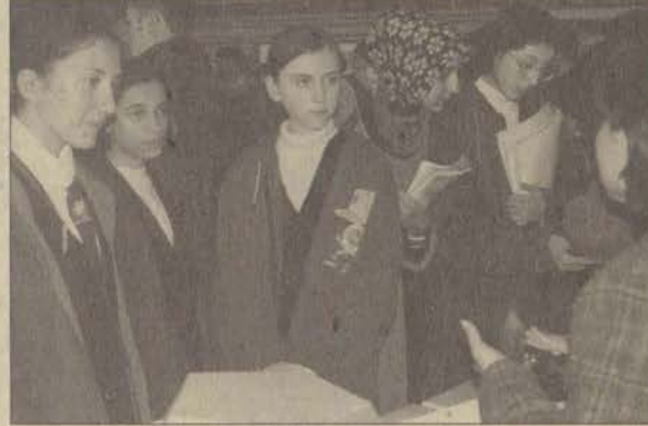
Liseli öğrenciler Anadolu Üniversitesi'yle ilgili her türlü bilgiyi bölüm stand görevlilerinden aldılar

sinin amacının üniversite adaylarının seçim problemlerini bir parça da olsa azaltmak olduğunu söyledi. Anadolu Üniversitesi'nin gerek sosyal gerek eğitimsel açıdan Türkiye'deki sayılı üniversitelerden biri olduğunu belirten Gürgen, "Anadolu Üniversitesi bu yıl evrensel eğitimde 40. yılını doldurması nedeniyle üniversite sınavlarında öğrencilere 40 milyon Lira burs veriyor. Bunun nedeni Anadolu Üniversitesinin başarısını pekiştirecek nitelikli öğrencileri üniversitemize kazandırmaktır" dedi. Açılış konuşmasının ardından