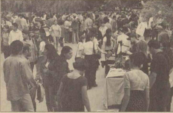
Renkli görüntülere sahne olan panayıra öğrenciler yoğun ilgi gösterdiler.

Üniversitemizde her yıl düzenlenen Geleneksel Öğrenci Şenliği, öğrenci ve öğretim elemanlarının katılımıyla düzenlendi. Renkli görüntülere sahne olan panayırda her fakültenin önünde birbirinden farklı görüntüler vardı. Yağın yağmura rağmen öğrenciler yine de coştı.