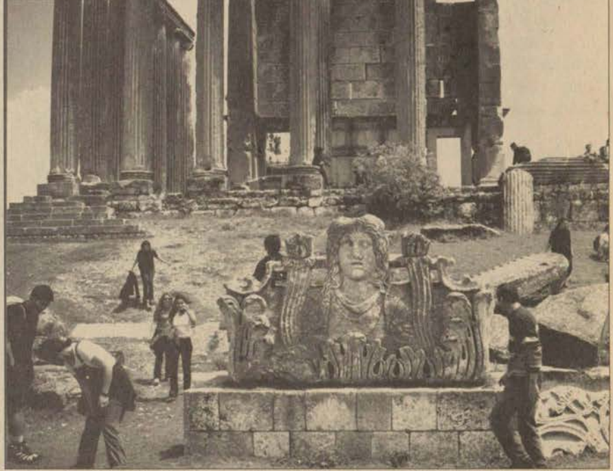
Anadolu Üniversitesi'nin gerçekleştirdiği ilk trekking gezisi Çavdarhisar'a yapıldı