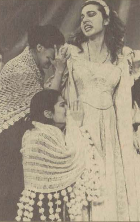
Kış Masalı oyunu Gösteri Günleri'98 kapsamında Konservatuvar öğrencileri tarafından sahnelendi.

Etkinlikler kapsamında bir de film gösterisi yer al-