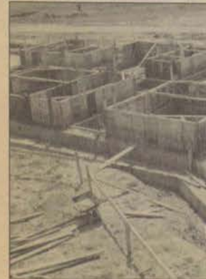
BESYO'nun yapımı devam eden idari binası

Açıköğretim Fakültesi Yönetim Bloğu oluşturuyor. 13.350 metrekare kapalı alana sahip bina, önümüzdeki öğretim yılına yetiştirilecek. Binada AÖF öğrencilerinin derslikleri ve idari kadroların odalarının yanı sıra, AÖF televizyon yayınlarının yapılacağı stüdyolar da yer alacak. 1993 yılında başlanan proje