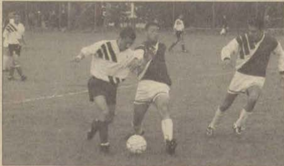
S.H.Y.O. Bilecik final karşılaşmasının sonucunu penaltılar belirledi.

Voleybol bayanlarda ise kupaya uzanan Eğitim oldu. Finalde karşılaştığı İletişim karşısında ilk seti kaybeden Eğitim diğer setlerden galip çıkarak kupayı elde ettiler. İletişim'den Prof.Dr.Deniz Güler gençlere taş çıkaran bir oyun sergilemesine rağmen yenilgiyi engellemeyemedi.