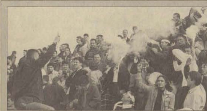
Öğrencilerin coşkuyla izlediği spor şenlikleri sona erdi

Halk Müziği Korosu, 26 Mayıs Carmina Burana, 27 Mayıs Modern Dans Gösterisi, 28 Mayıs Çoksesli Gençlik Korosu, 29 Mayıs Anadolu Yıldızları, 30 Mayıs Akrobasi ve Step Gösterisi, 30 Mayıs Türk Sanat Müziği Korosu, 31 Mayıs Çocuk Balesi.