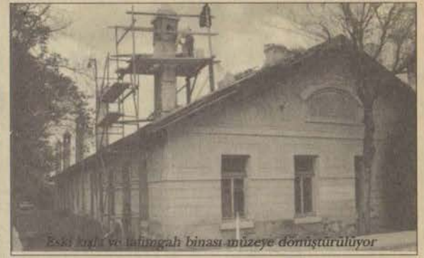
Eski kışla ve talıngah binası müzeye dönüştürülüyor

Başkanlık, ayrıca gelecekte Eskişehir'in en büyük kampüsü olmaya aday İki Eylül Kampü-