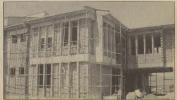
İnşaatı süren Müh. Mim. Fakültesi dekanlık binası

Öte yandan 5500 metrekare kapalı alana sahip olan Sivil Havacılık Yüksekokulu'na 950 metrekarelik derslik ve 2460 metrekare laboratuvar desteği yapılabilecek, 500 metrekarelik bir öğrenci kantini de önümüzdeki günlerde hizmete girecek. Yapımı tamamlanan 3 bin metrekarelik yeni hangarın yanında, inşaatının büyük bir bölümü tamamlanan 2583 metrekarelik D bloğu, 1275 metrekarelik F1 bloğu (yer hizmetleri), 1545 metrekarelik E bloğu (pilotaj), 1218 metrekarelik G (yönetim) bloğunun yapımına bu yıl başlanacak. Uçak pisti ile ilgili olarak da çalışmalarını sürdüren başkanlık, THY uçuşları için piste 3850 metrekarelik ilave alan yapacak. Ayrıca uçakların havaalanını saptayıp, iniş yapabilmesi için gerekli olan ILS Shelter sistemlerinin alt yapı çalışmaları sürüyor. DSI ile ortak yapılan bu çalışmanın bu yıl tamamlanması amaçlanıyor.