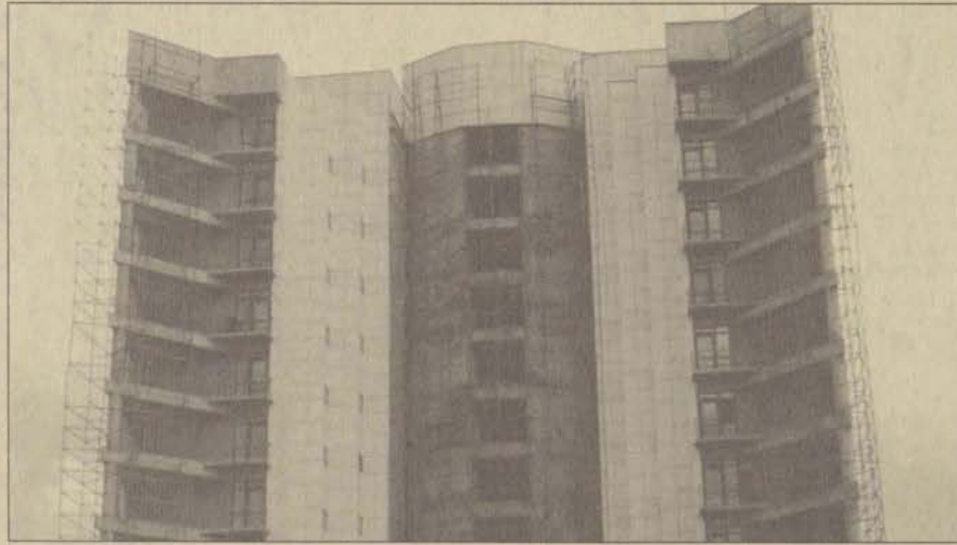
1998 yazında yapımı tamamlanacak olan AÖF yönetim bloğu

Açıköğretim Fakültesi Yönetim Bloğu oluşturuyor. 13.350 metrekare kapalı alana sahip bina, önümüzdeki öğretim yılına yetiştirilecek. Binada AÖF öğrencilerinin derslikleri ve idari kadroların odalarının yanı sıra, AÖF televizyon yayınlarının yapılacağı stüdyolar da yer alacak. 1993 yılında başlanan proje