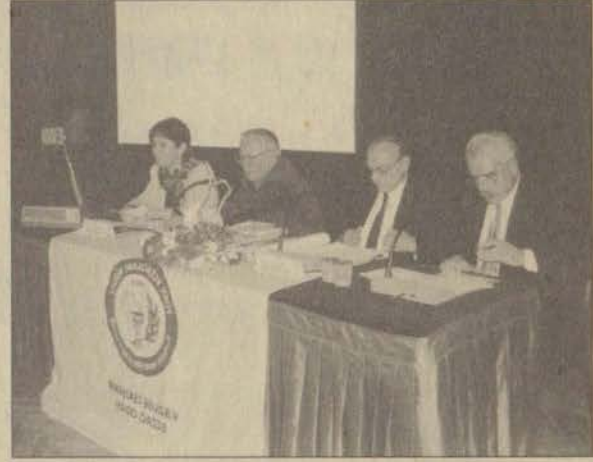
Eczacılık Bayramı Kutlama Töreni AKM'de düzenlendi.