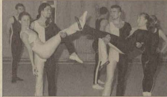
Ana. Ü. Modern Dans Grubu önemli bir başarıya imza attı.