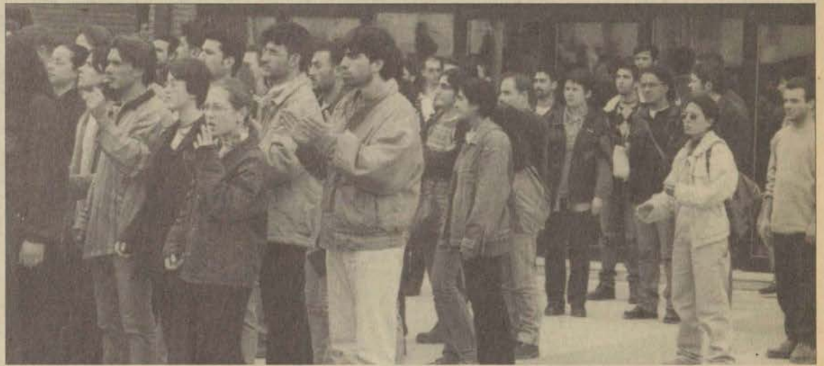
Öğrenciler yapılan saldırıya rektörlüğe yürüyerek protesto ettiler

“Olaylara karışanlar hakkında Öğrenci Disiplin Yönetmeliği'nin 9. ve 10. maddeleri uyarınca disiplin soruşturması başlattık. Bu kişilerin suçlu olduğu saptanırsa sözkonusu maddelere göre bir ya da iki yıl okuldan uzaklaştırma veya okuldan ihraç cezasına çarptırılabilirler.”