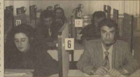
BMYO öğrencileri meslek öğrenimleri için gerekli olan her araca sahiptir