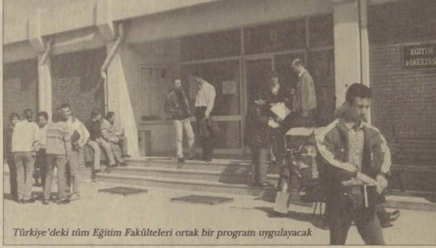
Türkiye'deki tüm Eğitim Fakülteleri ortak bir program uygulayacak

□ Eğitim Fakültesi'nde ana bilim dallarıyla birlikte mevcut programlar da değişiyor.