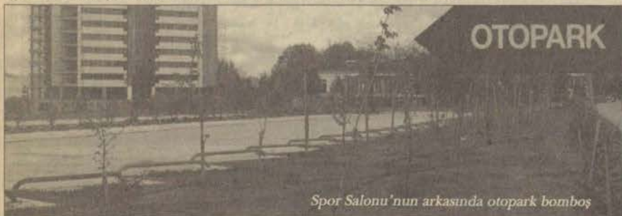
Spor Salonu'nun arkasında otopark bombos

Üniversite öğretim elemanlarının ve çalışanlarının işyerlerine en rahat şekilde ve zamanında ulaşmaları onların en doğal hakları olmasının yanında fakülte ve yüksekokulların önünde yürüyecek yerin kalmaması hatta bir otoparkın bombos olması ise yadırganacak bir nokta.