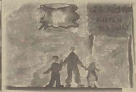
23 Nisan Ulusal Egemenlik ve Çocuk Bayramı için Eskişehir'de bir konser veren Barış Manço çocukların coşkulu ilgisiyle karşılaştı. Eskişehir Valisi'nde katıldığı konser Anadolu Üniversitesi'nde yapıldı. Günün anlam ve önemi ile ilgili olarak düzenlenen resim yarışmasında dereceye girenlere ödülleri verildi.

78. yılında Ulusal Egemenlik ve Çocuk Bayramı tüm yurttaki yapılan törenlerle kutlandı. Kutlamalar günün anlamına yakışır bir biçimde ve gerektirdiği önemde gerçekleşti.