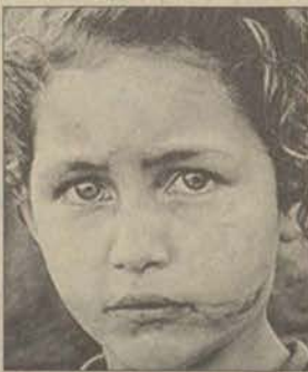
Sebastiao Salgado'nun Brezilya'dan bir fotoğrafı

ETV'nin teknik olarak destek verdiği hizmetçi eğitim için hazırlanan video çekimlerine Devlet Konservatuarı öğrencileri de oyuncu olarak katkıda bulunuyor.