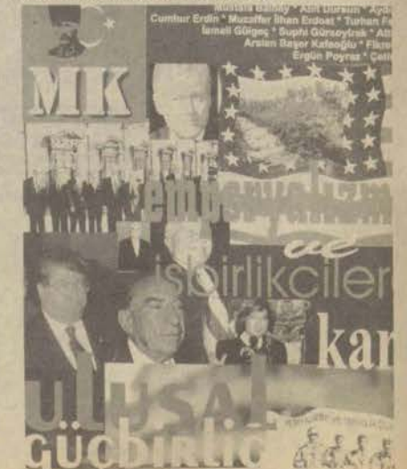
MK Dergisi 15. sayısını çıkarttı

Kaya, MK dergisini Eskişehir'de arayıp bulamayan üniversite öğrencilerinin dergiyi aramalarının yeterli olacağını belirtti.