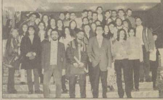
Geleceğin sosyologları Eskişehir'de buluştu