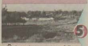
5 Üniversite mezunu köy