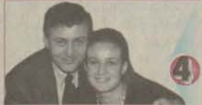
4 O bir insanlık abidesi