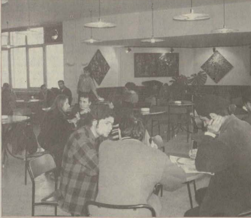
Güzel Sanatlar Fakültesi kantini temizliği, dekorasyonu ve satılan ürünlerin çeşitliliği ile göz dolduruyor.

Anadolu Üniversitesi'ndeki eğitim birimleri içinde Güzel Sanatlar Fakültesi kantini sahip olduğu özellikleriyle hemen kendini gösteriyor. 1993 yılında yeniden düzenlenen kantin örnek olabilecek niteliklere sahip. Kantin gerek dekorasyonu, gerekse yiyecek ve içecek çeşitliliği ile adeta lüks bir kafe izlenimi veriyor. Kantinin temizliği de hemen göze çarpan bir başka unsur. Başka fakültelerin öğrencileri ise GSF kantinine imrenerek bakıyorlar ve kendi fakültelerinin kantinlerinin niteliklerinin artmasını istiyorlar. Güzel Sanatlar Fakültesi öğrencileri de kantinlerinin sahip ol-