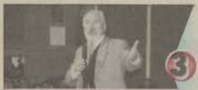
3 Kongar geleceğin Türkiye'sini anlattı