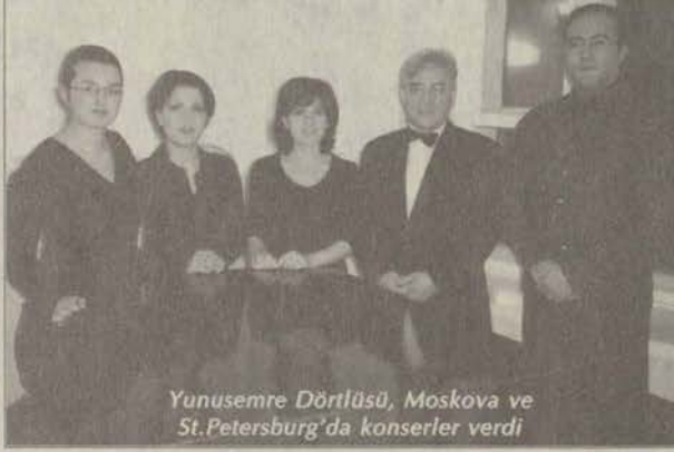
Yunusemre Dörtlüsü, Moskova ve St. Petersburg'da konserler verdi