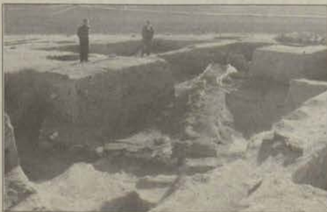
Köylü tarihine sahip çıkıyor

Vişnelik Mh. Savaş Cd. No: 36/A Tel.: 225 42 38 GSM : 0 532 505 03 35