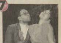
Tiyatro Anadolu Yeniden