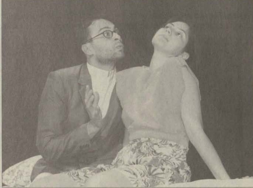
Kasım ayında perdelerini açacak olan Tiyatro Anadolu'nun sahneleyeceği Kader Kismet Oyunu'nun provalarından bir sahne.