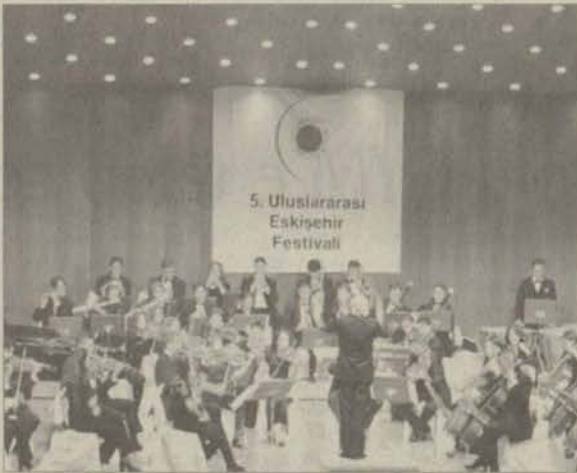
5. Uluslararası Eskişehir Festivali'nin kapanış konserini Anadolu Yıldızları yaptı

Anadolu Üniversitesi Devlet Konservatuarı Öğrenci Oda Orkestrası Anadolu Yıldızları, Almanya Köln Başkonsolosluğu'nun davetlisi olarak 26 Ekim-1 Kasım tarihleri arasında Almanya'da bir dizi konser gerçekleştirecek.