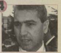
'Çölde vaha yaratmak'