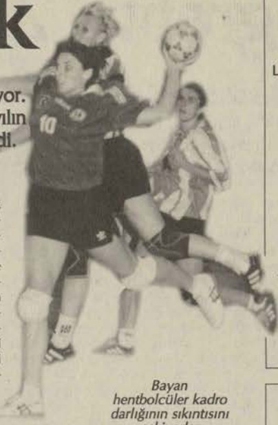
Bayan hentbolcüler kadro darlığının sıkıntısını çekiyorlar

Hakemler: Vehbi İşgören, Naci Onuk Ana. Ü. : Şenay ★★, Bilge(5)★★★, İrina★★★, Donka(6)★★★★, Demet★★, Oulina(1)★★, Gonca(6)★★★, Derya(1)★★ Antrenör: Sinan Öner TMO: Yelena★, Öznu★★★, Olessia(9)★★★★, Hülya(4)★★★★, Serpil(2)★★, Şenay(1)★★, Natalla(1), Ayşe(3)★★, Selin★★ Antrenör: Sabri Şener Ozan