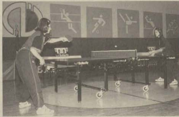
Fransa şampiyonu maça çıkmayınca bayan masa tenisçilerimiz gösteri maçı yaptılar.

5 Eylül pazar günü 14:00'de Anadolu Üniversitesi Kapalı