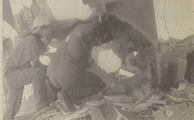
Üniversitemiz öğretim elemanlarının da üyesi bulunduğu ESMAG, deprem bölgesindeki arama ve kurtarma çalışmalarında onlarca insanı yaşama döndürmüştü.