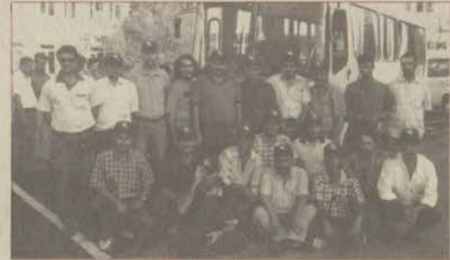
Deprem bölgesindeki arama-kurtarma çalışmalarına gönüllü olarak katılan ETV, atölyeler ve Sivil Havacılık çalışanları, üniversite bünyesinde kurulacak bir arama-kurtarma ekibinde sevk görevi alacaklarını bildirdiler.