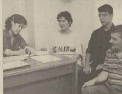
Üniversiteyi kazanan öğrenciler ilk olarak barınma sorunlarını çözmeye çalışıyorlar. İlk başvurdukları yerlerden biri de Psikolojik Danışma ve Rehberlik Birimi oluyor.