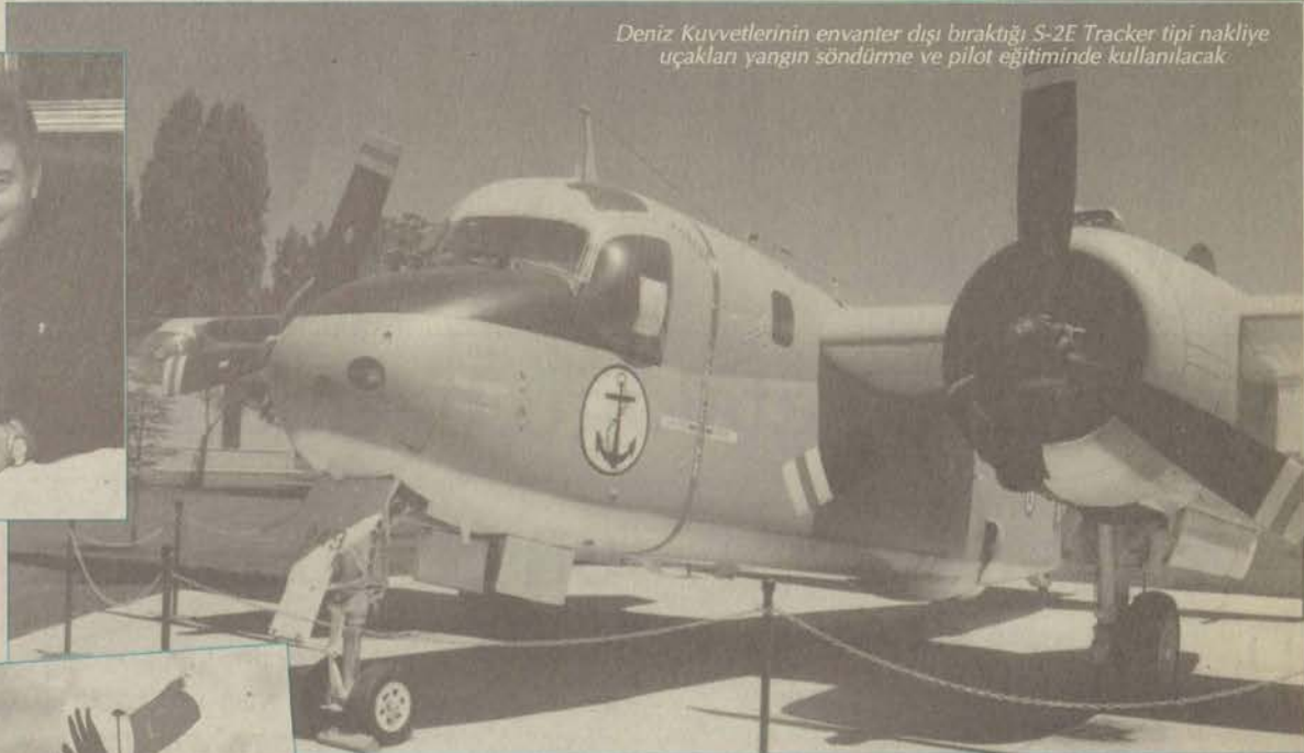
Deniz Kuvvetlerinin envanter dışı bıraktığı S-2E Tracker tipi nakliye uçakları yangın söndürme ve pilot eğitiminde kullanılacak.