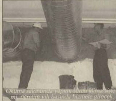
Okuma salonunda yapımı süren klima sistemi, öğretim yılı başında hizmete girecek

Yeni klima sistemi 3 kattan oluşan ve aynı anda 250 kişinin faydalandığı salonun iç döşeme tesisatı tamamlandığını belirten yetkililer, salonun dış döşemesine ise önümüzdeki günlerde tamamlanacağını bildirdiler. Kütüphanenin klima sisteminin yeni öğretim yılına yetiştirilmesi planlanıyor.