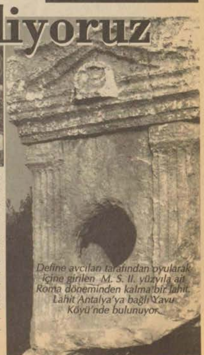
Define avcıları tarafından oyularak içine girilen M. S. II. yüzyıla ait Roma döneminden kalma bir Lahit Antalya'ya bağlı Yavru Köyü'nde bulunuyor.