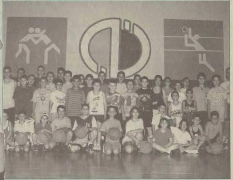
Yaklaşık 50 öğrencinin katılacağı yaz spor okulu Türkiye'ye yeni basketbolcular kazandırmayı amaçlıyor.