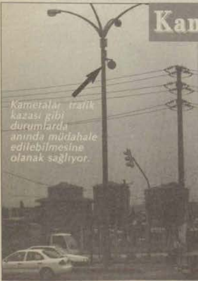
Kameralar trafik kazası gibi durumlarda anında müdahale edilebilmesine olanak sağlıyor.