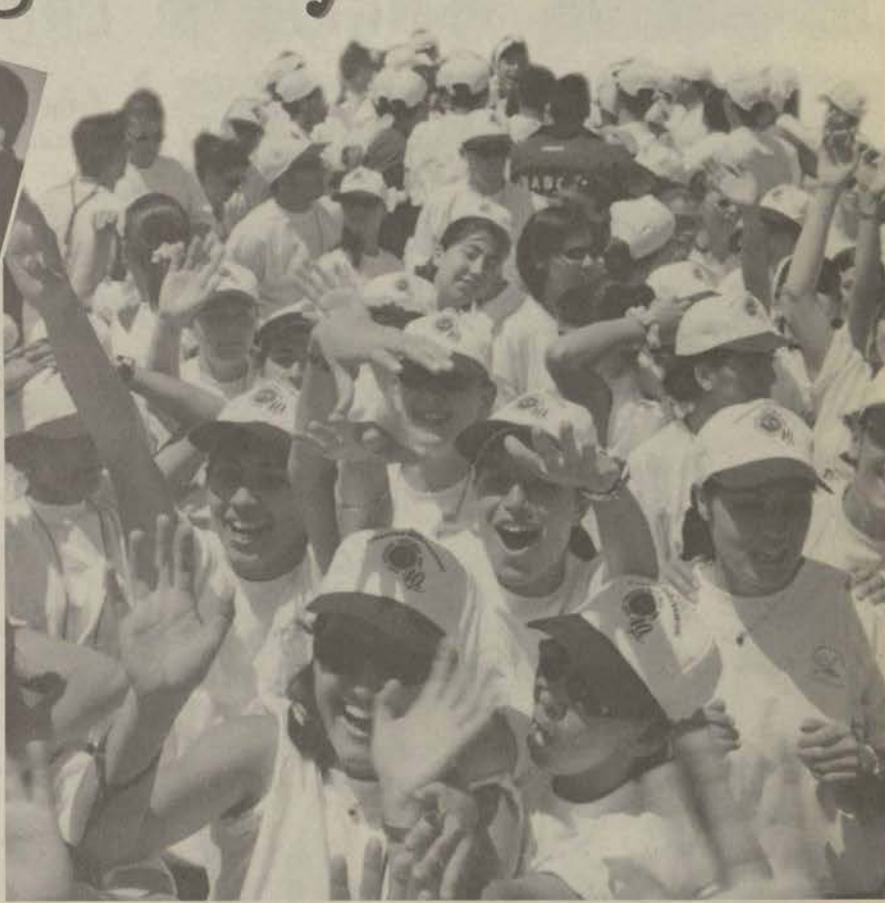
Üniversite oyunları açılış töreninde Anadolu Üniversitesi Sporcuları uyuamları ve canlılıkları ile dikkat çektiler.

Son yedi yılın şampiyonu olan Bayan Hentbol takımımız yarı