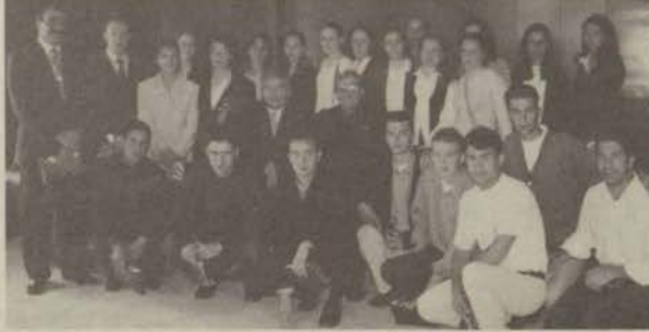
19 Mayıs gösterilerine katılan BESYO öğrencileri, Rektör Ataç'ı ziyaret etti.

19 Mayıs Gençlik ve Spor Bayramı bu yıl da coşkuyla kutlandı. Eskişehir'deki gösterilere katılan Anadolu Üniversitesi Beden Eğitimi ve Spor Yüksekokulu, törenleri izleyenlerin beğenisini kazandı. Anadolu Üniversitesi Rektörü Engin Ataç da, başarılarından dolayı BESYO öğretim üyelerini ve öğrencileri kabul ederek teşekkür etti. Ataç, gösteriyi büyük bir zevkle izlediğini belirterek, okulun başa-