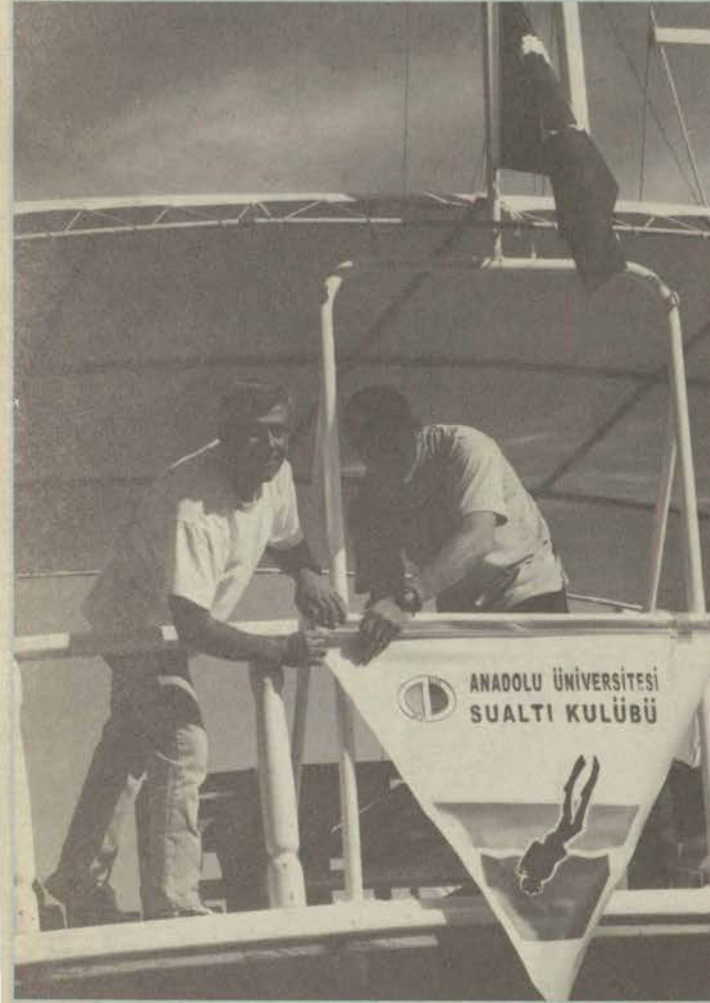
Sualtı Kulübü üyeleri 15-19 Mayıs tarihleri arasında Fethiye'de dalışlar gerçekleştirdiler. Kursiyerlerden birçoğu ilk defa dalış yapıyordu. İlk dalış derslerini de burada aldılar.