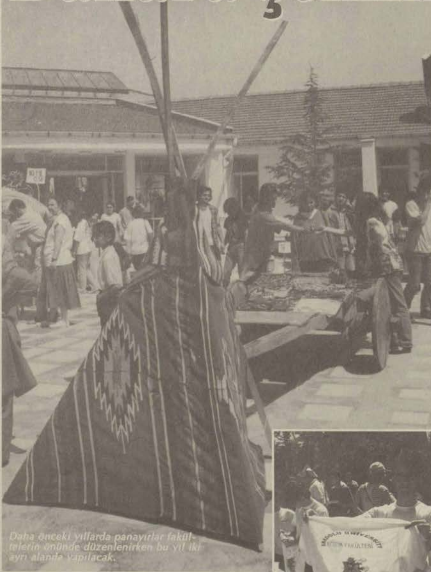
Daha önceki yıllarda panayırlar fakültelerin önünde düzenlenirken bu yıl iki ayrı alanda yapılacak.