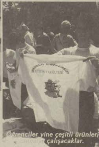
Öğrenciler yine çeşitli ürünleri pazarlama çalışacaklar.

Anadolu Üniversitesi'nde geleneksel olarak her yıl Mayıs ayında düzenlenen Bahar Şenliği'nde, bu yıl da tiyatrodan konsere, gösteriden sinema günlerine kadar birçok etkinliğe yer veriliyor.