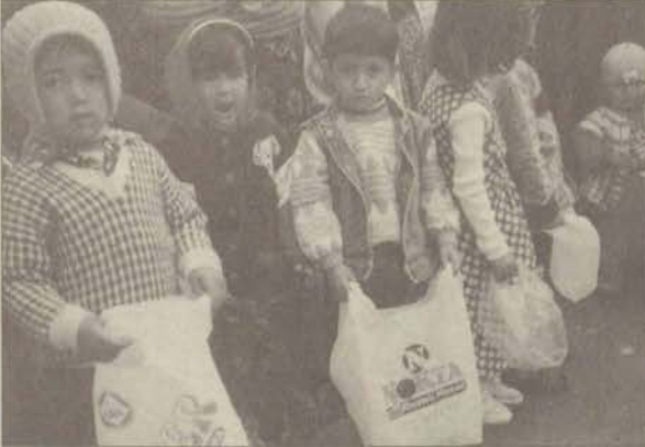
Antalya'da, Adrasanlı köylü çocuklara bayram sabahı traktörün üstünden şeker dağıtılması belgesel filme konu oldu.

ETV çalışanlarının AÖF desteğiyle çektiği ve bu yıl festivallere gönderdiği tüm filmler finale kaldı.