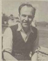
Cemal Reşit Rey, Ulvi Cemal Erkin, Ahmet Adnan Saygun

cil Kazım Akses ve Muammer Sun gibi Çağdaş Türk bestecilerinin birbirinden değerli eserleri yer aldı. Anadolu Üniversitesi Devlet Konservatuarı Sahne Sanatları Bölümü Uygulama Sahnesinde gerçekleşen konserin girişinde konserde çalışacak eserlerin bestecilerini tüm yönleriyle tanıtmak amacıyla bestecilerin biyografilerinin de yer aldığı pusulalar dağıtıldı.