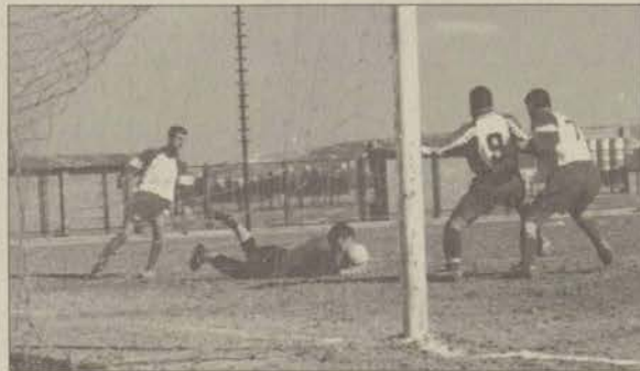
Ana. Ü. üstün oyununu maçın sonuna kadar sürdüremeyince 3. Lig hayallerini erteledi.

üzere toplam altı branşta birbirleri ile yarışacak. Oyunlardan düzenlenecek olan Türkiye Şampiyonası müsabakaları yapılacak. Basketbol, futbol, hentbol ve voleybolda ise süper lig ve süper lige terfi maçları düzenlenecek. Ana.Ü'nün tüm branşlarda katılım sağlayacağı oyunlarda erkek basketbol, hentbol ve futbolda süper lige çıkması bekleniyor.