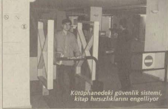
Kütüphanedeki güvenlik sistemi, kitap hırsızlıklarını engelliyor

Kütüphane güvenlik sisteminin okuyucu üzerinde olumsuz etkiler yaratmadığını, aksine gereken kitabın mutlaka bulunacağı fikrini aşılayacağını söyleyen Yılmaz, sistemin öğrenciye gü-