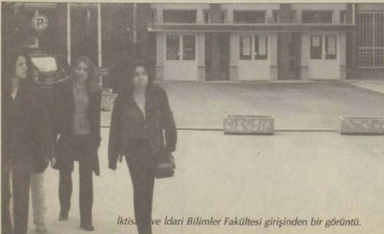
İktisadi ve İdari Bilimler Fakültesi girişinden bir görüntü.

Bu bölümde öğrencilere kendi çevrelerinden başlayarak, Türkiye'de ve dünyada meydana gelen iktisadi olayları daha iyi kavramalarını, değerlendirmelerini ve olayların neden ve sonuçlarını çözümlerini sağlayacak bilgiler veriliyor. Bu amaçla yönelik olarak program, iktisat ek-seni üzerine kurulu kuramsal ve