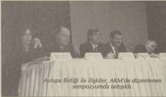
Avrupa Birliği ile ilişkiler, AKM'de düzenlenen sempozyumda tartışıldı.

liğine itilmeye çalışıldığına işaret etti.