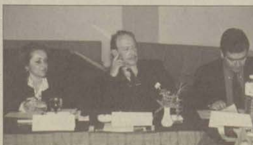
İletişim fakülteleri dekanları Ankara'da toplandı.

(ÖSS) sınavıyla iletişim fakültelerine öğrenci alınırken eşit ağırlıklı puan sisteminin uygulanmasını isterken aynı zamanda öğrenci alımında "özel yetenek" sınavı uygulanmasını