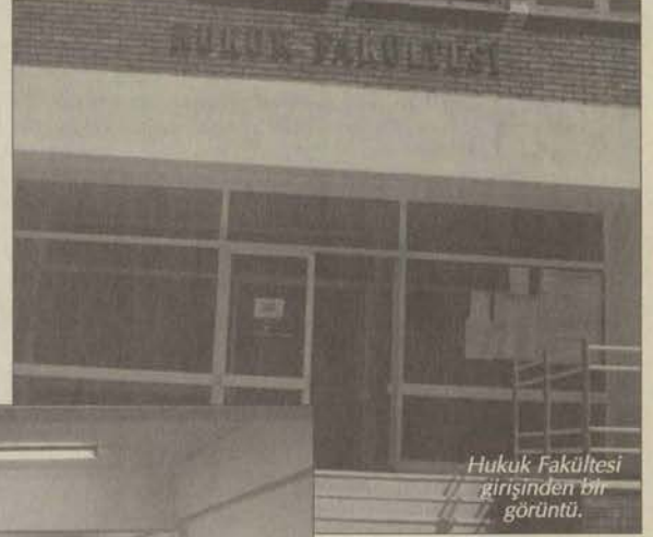
Hukuk Fakültesi girişinden bir görüntü.

Çalışma Ekonomisi ve Endüstri İlişkileri Bölümü programları, 4