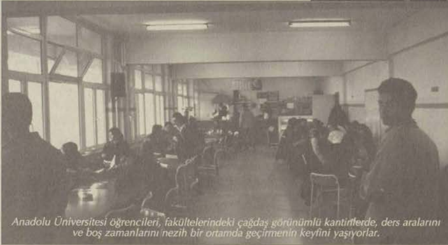
Anadolu Üniversitesi öğrencileri, fakültelerindeki çağdaş görünümlü kantinlerde, ders aralarını ve boş zamanlarını nezh bir ortamda geçirmenin keyfini yaşıyorlar.

Zengin öğretim üyesi kadrosuna sahip olan fakülte, İşletme, İktisat, Maliye, Çalışma Ekonomisi ve Endüstri İlişkileri olmak