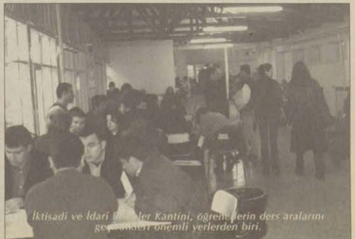
İktisadi ve İdari Bilimler Kantini, öğrencilerin ders aralarını geçirmenin önemli yerlerinden biri.