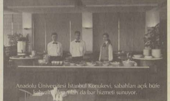
Anadolu Üniversitesi İstanbul Konukevi; sabahları açık büfe kahvaltı konuklarını da bar hizmeti sunuyor.