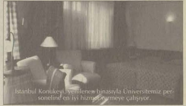
İstanbul Konukevi, yenilenen binasıyla Üniversitemiz personeline en iyi hizmet vermeye çalışıyor.