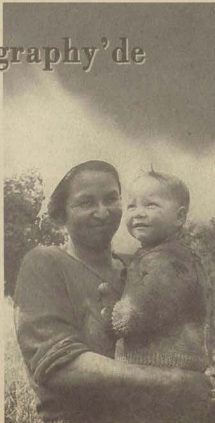
Sadık Demiröz'ün "Populer Photography'de yayınlanan bir fotoğrafı.