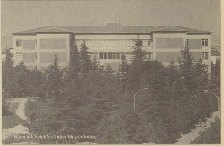
Eczacılık Fakültesi'nden bir görünüm.

Edebiyat Fakültesi 1993 yılında kurulmuş olmakla beraber Anadolu Üniversitesi'nin en yeni bölümlerinden biridir. Önümüzdeki yıl yeni binasında öğretime devam edecek olan fakültede, Arkeoloji, Sanat Tarihi, Sosyoloji ve Tarih bölümü bulunmakta beraber bu bölümlere 1999-2000 öğretim yılında Türk Dili ve Edebiyatı Bölümü de katıla-