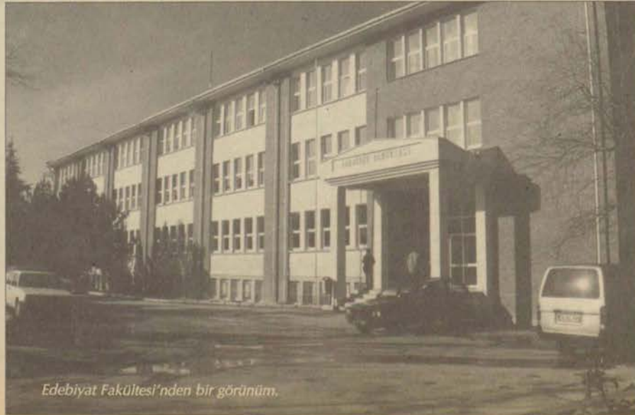
Edebiyat Fakültesi'nden bir görünüm.

Yeni açılan bölüme 1999-2000 öğretim yılında öğrenci alınmaya başlanacaktır. 21. Yüzyılın gerçeklerini göz önüne alarak yetiştirmeyi amaçlanan öğrencilerin bu alanda araştırmacı, öğretmen, basın ve yayın dünyasında çalışabilecek uzman olabilecekleri düşünülmektedir.