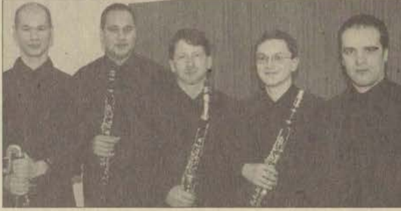
Kıyafetleri ve mimikleriyle ilginç bir görünüme sahip olan Vienna Clarinet Connection grubu 5 yetenekli sanatçıdan oluşuyor.

Avusturya Başkonsolosluğu Kültür Ofisi'nin katkılarıyla Eskişehir'e gelen Vienna Clarinet Connection grubu 22 Şubat 1999 günü verdikleri konserle sanat severlerin beğenisini kazandı.