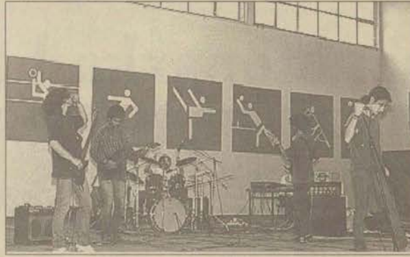
Efes Güneşi Anadolu Üniversitesi spor salonunda verdikleri bir konser sırasında

cak birikimimiz, yeteneğimiz ve materyalimiz var. Ama olması gereken önemli unsur imkan. Yetersiz bir kaç stüdyo dışında, ne sponsor, ne de maddi olanak bulabiliyoruz. Eskişehir'de bunların hiç birisi yok. Bizim tek istediğimiz yardım, ilgi ve destek... İki sene önce üniversitemiz tarafından bize bir stüdyo sağlandı. Beş grup haftada birer gün çalışabiliyorduk. Yeterli değildi; ama en azından vardı. Ama nedense daha sonra stüdyomuzda elimizden alındı. Anlayacağınız okul da ilgisiz kaldı. Ancak yeni bir yapıya kavuşan öğrenci kulüpleri ile bu çalışmalarımızın Üniversitemiz tarafından yine destekleneceğini bekliyoruz."