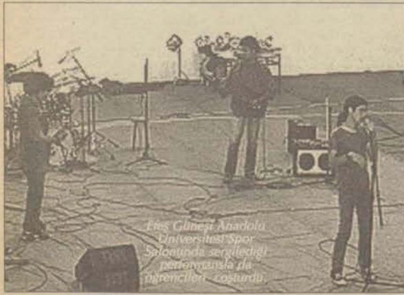
Efes Güneşi Anadolu Üniversitesi Spor Salonunda sergilediği performansla da öğrencileri coşturdu.

"Bu yıl Eskişehir'deki öğrenciliğimizin son yılı. Mezun olabilmek için müziğe ayırdığımız zamandan vazgeçtik artık. Sadece bir veda konseri düzenlemek istiyoruz. Bundan sonra "Efes Güneşi" büyük bir ihtimalle tarih olacak. Ben burada yeni kurulacak gruplara, sponsor olabilecek kişilere ve hepsinden önce iki üniversiteye de bir şeyler söylemek istiyorum."