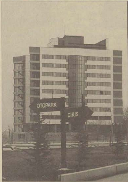
Açıköğretim'in yeni binası, uzaktan eğitim veren İktisat ve İşletme Fakülteleri ile diğer tüm birimleri bir merkezde toplayacak şekilde inşa edildi.