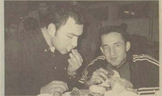
Ramazan ayında oruç tutan çoğu ikinci öğretim öğrencileri, okulun sağladığı imkanlardan memnun. Bu öğrenciler hamburgerle oruç açıp dersen giriyor.

Ramazan ayının gelmesi ile birlikte oruç tutan ve okulda iftar eden öğrencilere kantinler hızır gibi yetişiyor.