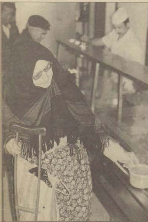
Yardıma muhtaç nineler dedeler, ellerinde kapları ile bir taş çorba almak için, bastonlarına dayanarak zor koşullarda ulaştıkları Aşevi'nde o gün de sıcak yemek alabilmenin mutluluğunu yaşıyorlar.

"Akşam saatlerinde öğrencilere her türlü imkanı sağlamaya çalışıyoruz. Şimdi çorba servisimiz de başladı. Bunun yanında öğlen ve iftar saatlerinde de servisi kesmiyoruz. Oruçlu olan öğrenciler de bu durumda mağdur duruma düşmüyorlar. Bizde oruçlu olduğumuz halde, öğrenciye hizmeti aksatmadan sürdürmeye çalışıyoruz. Ayrıca sadece İİBF öğrencilerine değil diğer fakülte öğrencilerine de hizmet ediyoruz."