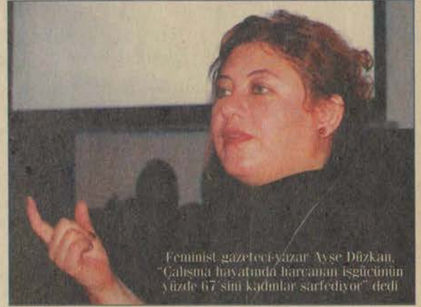
Feminist gazeteci-yazar Ayşe Düzkın, "Çalışma hayatında harcanan işgücünün yüzde 67'sini kadınlar sarfediyor" dedi

Çalışma hayatında harcanan işgücününü de %