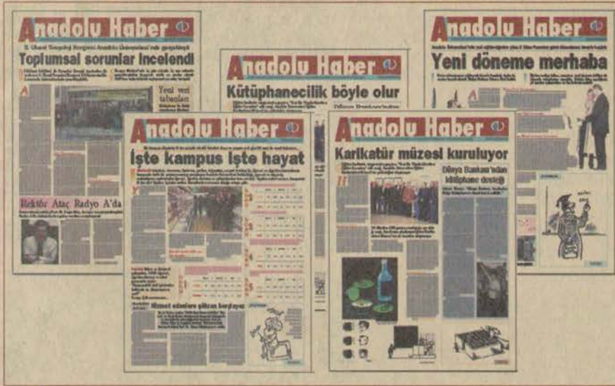
Anadolu Üniversitesi'nde 2000 yılının Anadolu Haber'e de konu olan, eğitim ve araştırmada alanlarındaki birçok yeni adımla tamamlandı

Üniversitemiz, "evrensel üniversite" hedefi doğrultusunda birçok kurumla işbirliğine gitti. Amerika San Diego Devlet Üniversitesi'yle yapılan ve ortaklaşa çalışmayı öngören anlaşma