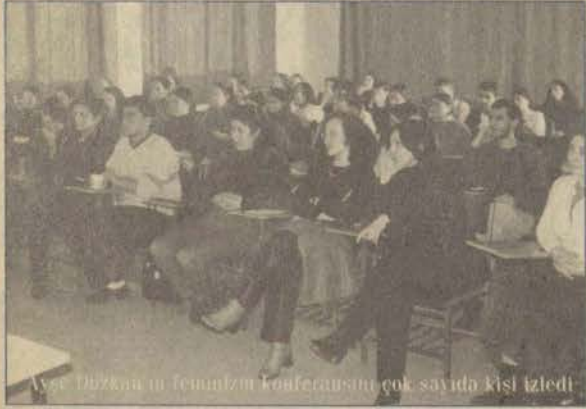
Ayşe Düzkın'ın feminizm konferansını çok sayıda kişi izledi