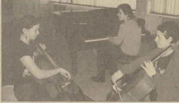
Üniversitemiz konservatuvarı öğrencileri ile mezunları, dünyanın çeşitli konservatuvarlarında da eğitim hakkı kazandı

Yurtdışındaki okullarda eğitimlerini devam ettirmeyi hak kazanan öğrencilerin