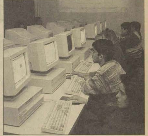
Bilgisayar Destekli Eğitim Birimi, internete dayalı eğitim teknolojilerini kullanarak derslere yeni bir boyut kazandırdı.